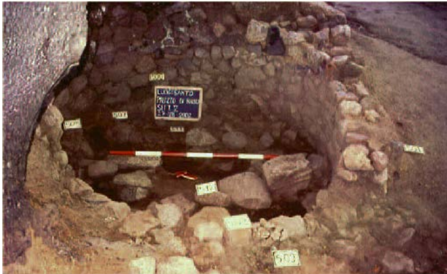
Abb. 9 - Luogosanto, Ortschaft Santu Stevanu . Der Brennofen während der Grabungsarbeiten (aus: Pinna, Corda in c.d.s., S. 150, Abb. 8).

Unweit der Kirche wurden bei archäologischen Untersuchungen weitere Mauerreste gefunden - die wahrscheinlich auf die Präsenz von noch nicht identifizierten Bauten hindeuten - sowie ein Brennofen (Abb. 9) mit rundem Grundriss für die Produktion von Ziegeln (Abb. 10) und Keramik, die zur Abdeckung des Komplexes dienten.