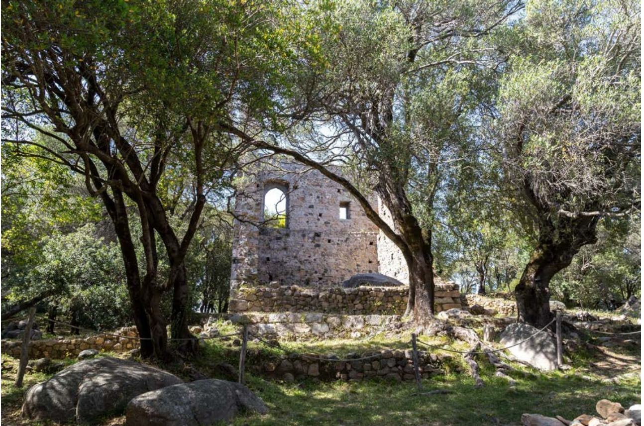
Abb. 2 - Palazzo di Baldu , gesehen von Südosten.

herum angeordnet sind, der einen Eingang auf der Nordostseite aufweist (Abb. 1). Der Donjon in der Südostecke ist ca. 10 Meter hoch, war jedoch wahrscheinlich höher, da er außer den drei Stockwerken eine Terrasse aufweisen musste, die eine gute Sicht auf die Umgebung bietet.