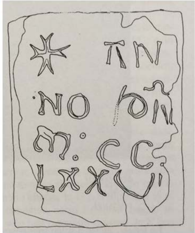
Abb. 1 – Der Block mit dem ersten Teil der Inschrift, die das Datum 1276 angibt (aus: Spanu 2003 b, S. 57).