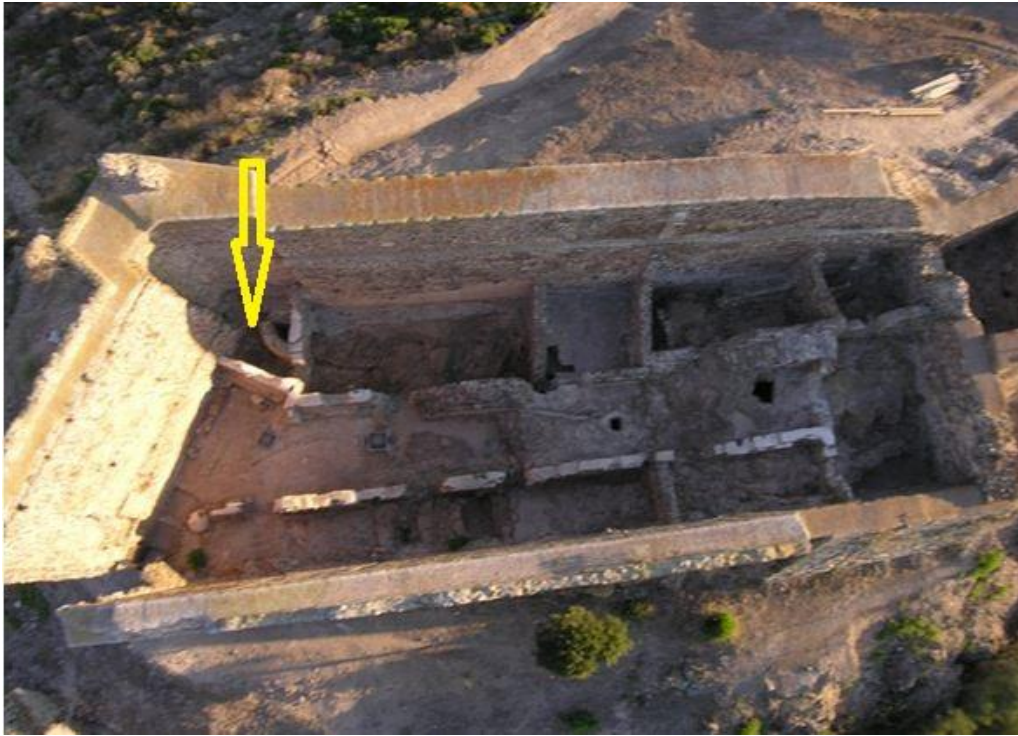
Abb. 2 - Der Bergfried, gesehen von oben, mit Angabe des Raums alpha (Überarbeitung von M. G. Arru).