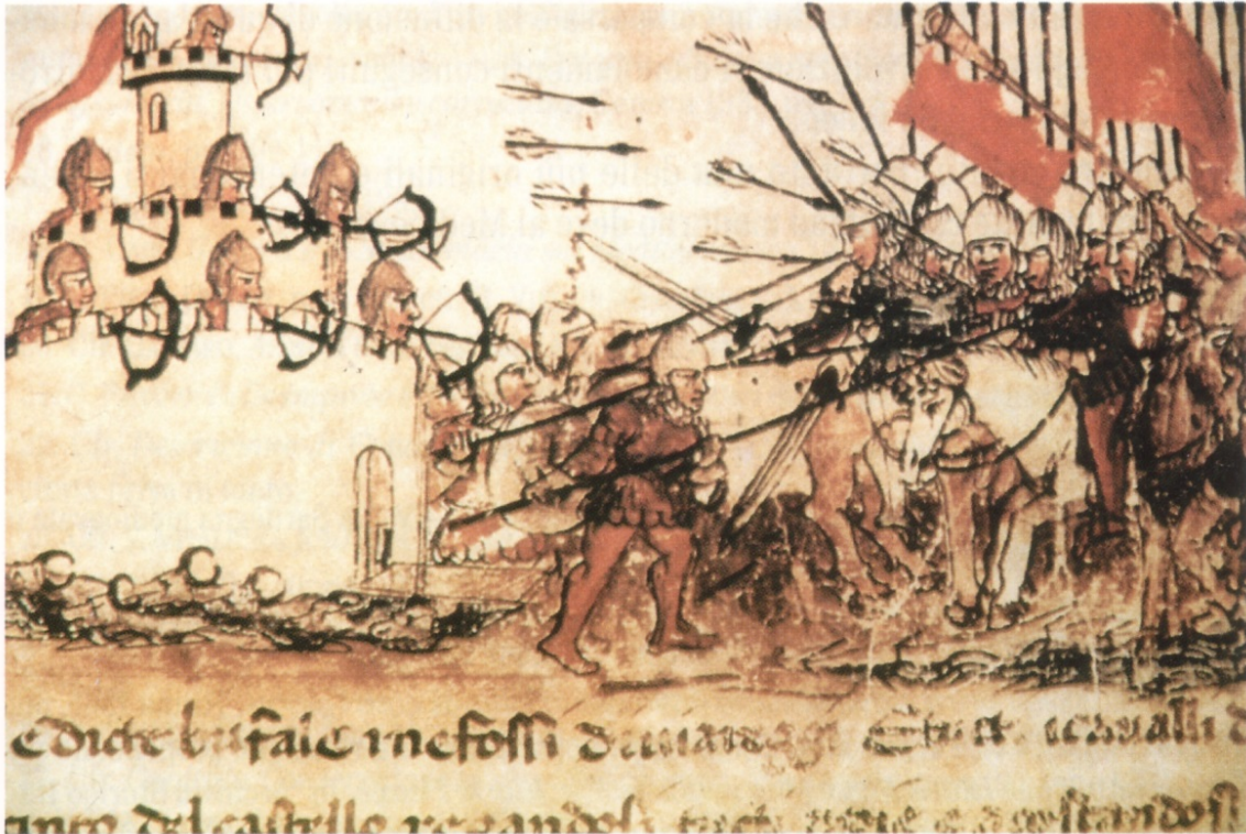
Abb. 3 - Die Verteidigung einer Burg (aus: Monteverde, Fois 1997, S. 251).

Es gab daher eine große Diskrepanz zwischen der Anzahl der Soldaten und dem zu verteidigenden Raum, auch wenn die Kenntnis des Territoriums und der Umgebung durch die Kämpfer erklären könnte, wie die Möglichkeiten dieser kleinen Kontingente auf die bestmögliche Weise genutzt wurden 3 .