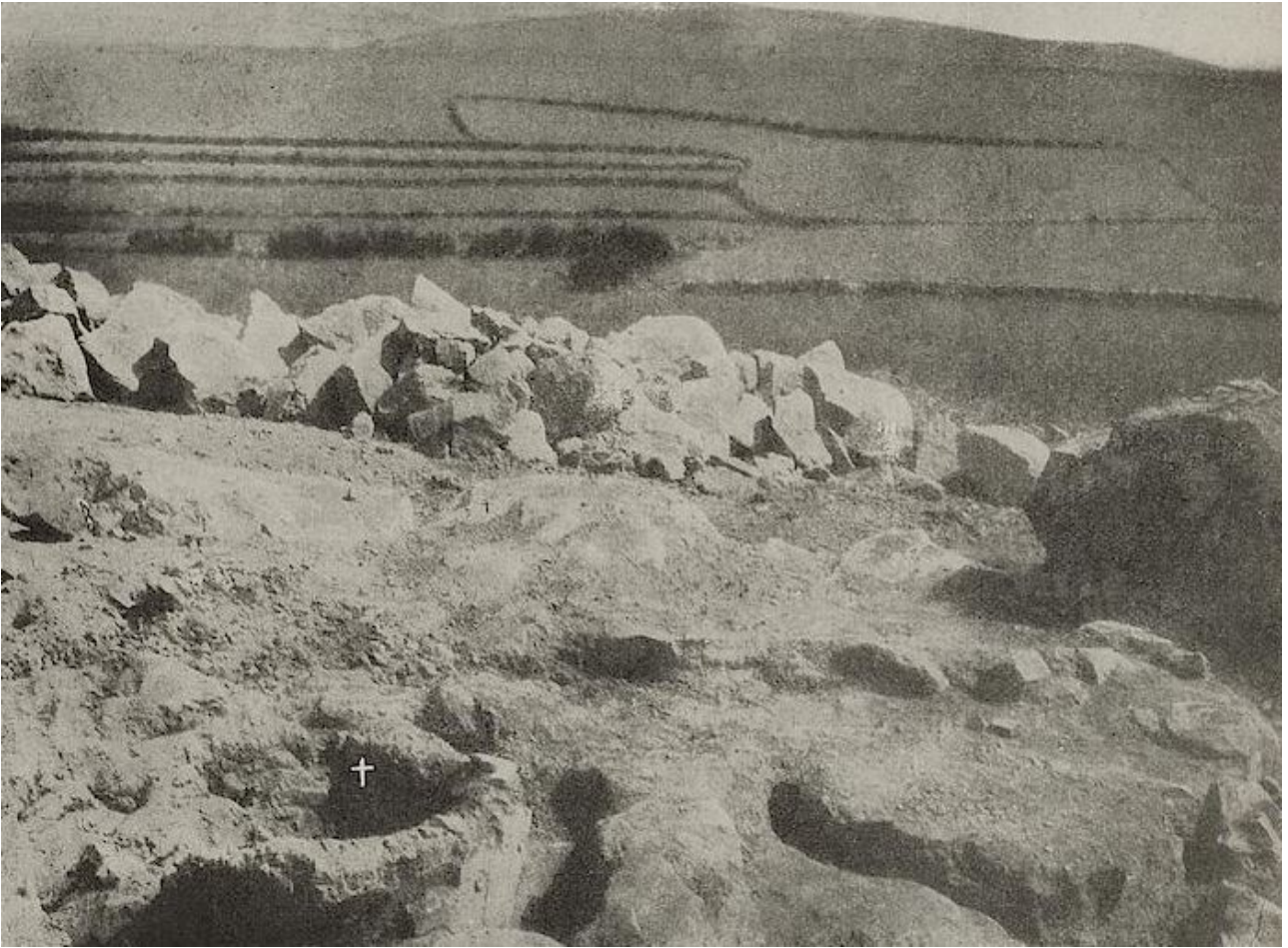
Abb. 1 - Die Kegelstumpfstruktur, die von A. Taramelli als Überreste eines Schmelzofen interpretiert wurden (aus: Taramelli 1918, Sammlung 111-112, Abb. 112).

Bei der Entdeckung im Jahr 1913 interpretiert der Archäologe Antonio Taramelli sie als Anlage zum Schmelzen von Metall (Abb. 1-2) 3 während die zwischen 1975 und 1978 von Miriam S. Balmuth durchgeführten Grabungsarbeiten es gestatteten, sie als nordafrikanische "tabuns" mit Fingerabdrücken zu identifizieren (Abb. 3) 4 .