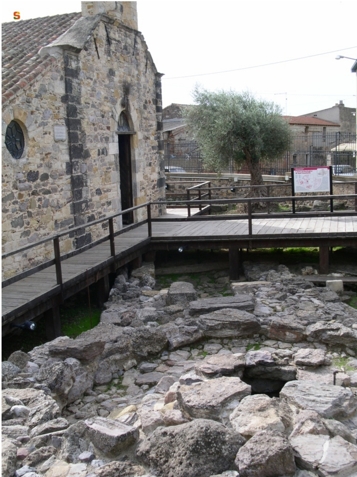
Abb. 6 - Die Kirche und der heiligen Brunnen von S. Anastasia.