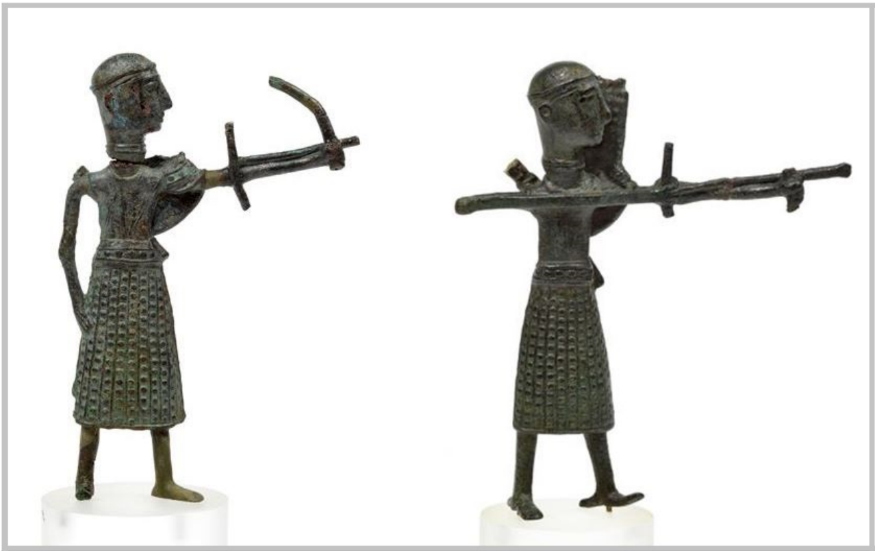
Abb. 2 - Die kleinen Bronzen von Bogenschützen, die auf der Fundstätte Sa Costa gefunden wurden.