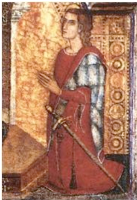
Abb. 2 - Mariano IV., Detail des Polyptychons Aus der Kirche S. Nicola di Ottana (aus: Ortu 2011, Deckblatt).

Die Ereignisse überschlugen sich, als Eleonora die Feindseligkeiten gegenüber den Aragonesern neu eröffnete. Die Entscheidung, den Krieg fortzusetzen, reifte zu dem Zeitpunkt, an dem Brancaleone sich in zweifacher Rolle als treuer Untertan des Königs von Aragon und Gatte der rebellischen Giudicessa von Arborea in Barcelona befand. Pietro IV. ließ Brancaleone festnehmen und in den ersten Monaten des Jahres 1384 wurde er nach Sardinien verlegt, um ihn als Druckmittel gegen Eleonora zu benutzen, um schnell Friedensverhandlungen zugunsten von Aragon zu erreichen und um sich als Geisel auszuliefern, im Wechsel gegen die Freiheit des Gatten, des kleinen Giudice Federico.