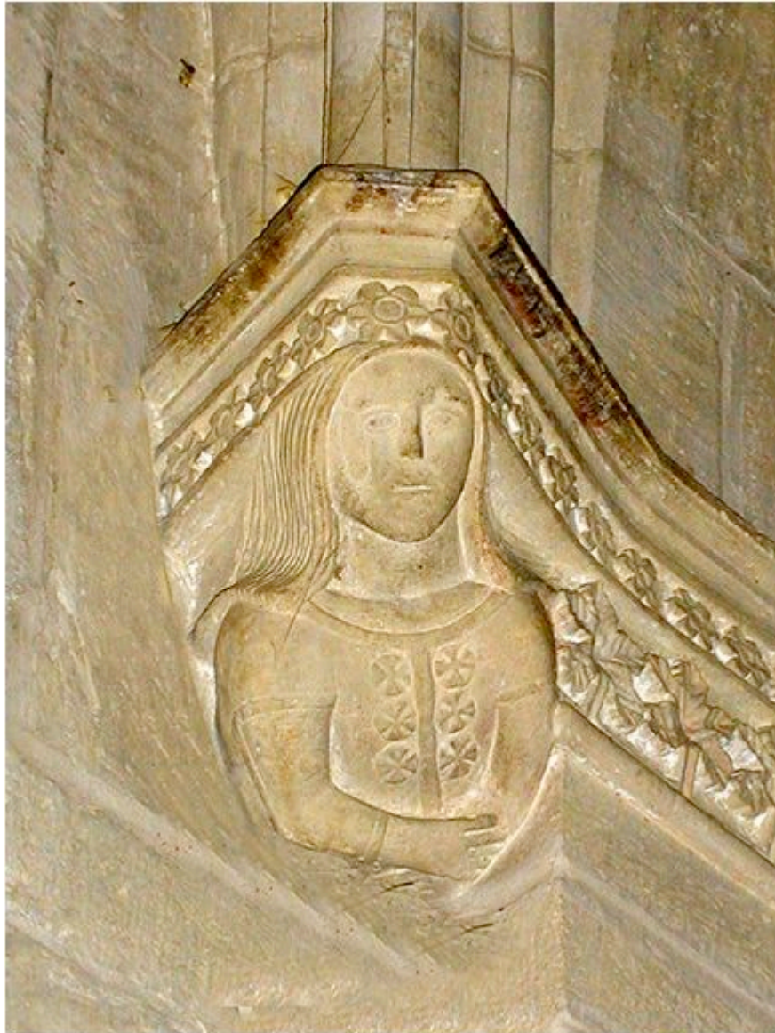
Abb. 3 - Porträt von Eleonora d'Arborea, architektonisches Detail der Kirche San Gavino in S. Gavino Monreale.

Am 1. Januar 1390 wurde eine Vereinbarung über die Freilassung von Brancaleone Doria erzielt, der die Burg von Cagliari einige Tage später verlassen konnte.