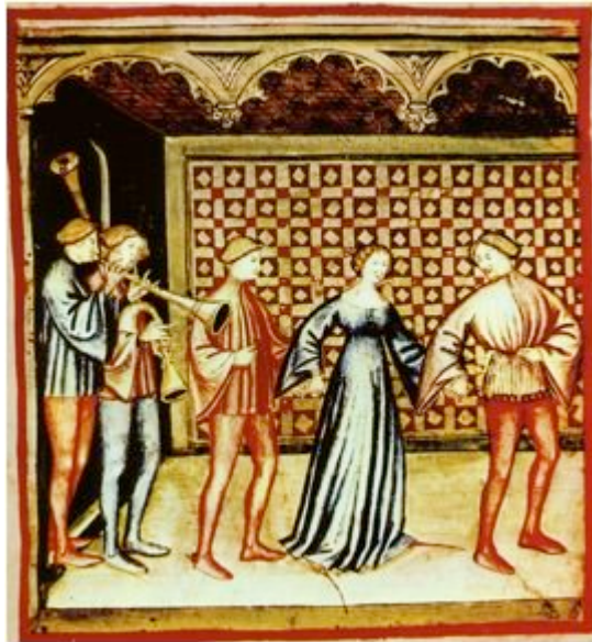
Abb. 4 - Musik und Tanz, Illustration aus Tacuinus sanitatis casanatensis , 14. Jahrhundert ( http://it.wikipedia.org/wiki/Musica_medievale#mediaviewer/File:40-svaggi,suono_e_ballo,Taccuino_Sanitatis,_Casanatense_4182.jpg ).