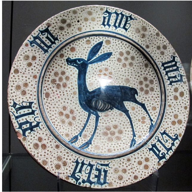
Abb. 3 - Beispiel für ein Becken aus der „Ave-Maria-Serie“, Manises ( http://commons.wikimedia.org/wiki/File:Manises,_bacile_con_cerbiatto_e_iscrizione_ave_maria_gratia_plena,_1400-1450_ca..JPG ).