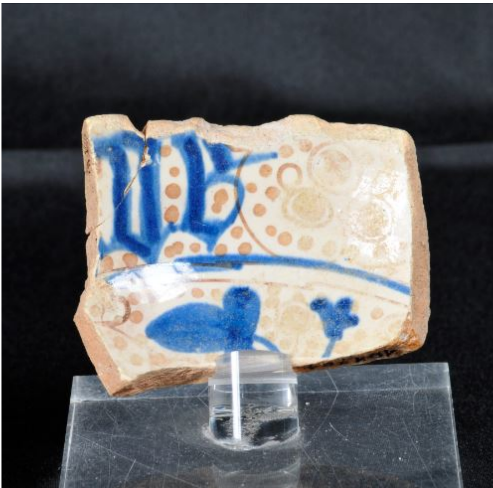
Abb. 1 - Fragment einer Schale mit den Buchstaben „VE“ aus der Burg Monreale.

Während der archäologischen Forschungsarbeiten, die im Jahr 1992 durchgeführt wurden, wurde auf der Halde der Burg Monreale, zusammen mit anderen Fundstücken aus Keramik, ein Fragment der Wand einer halbrunden Schale aus valencianischer Majolika gefunden, dekoriert in Blau und Lustrum, die aus der so genannten „Ave-Maria-Serie“ stammt (Abb. 1).