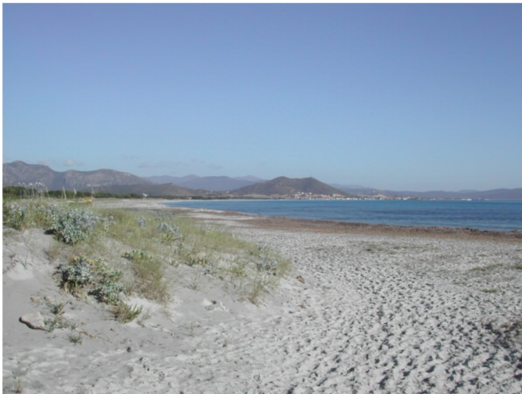
Abb. 3 - Küsten im Norden von Santa Lucia di Siniscola.