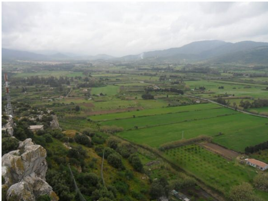
Abb. 3 - Das Territorium nordwestlich der Fava-Burg, wo wahrscheinlich die Villa von Arischion lag.