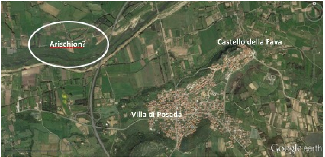
Abb. 2 - Wahrscheinliche Lage der Villa von Arischion (von Google Earth, Überarbeitung von E. Dirminti).