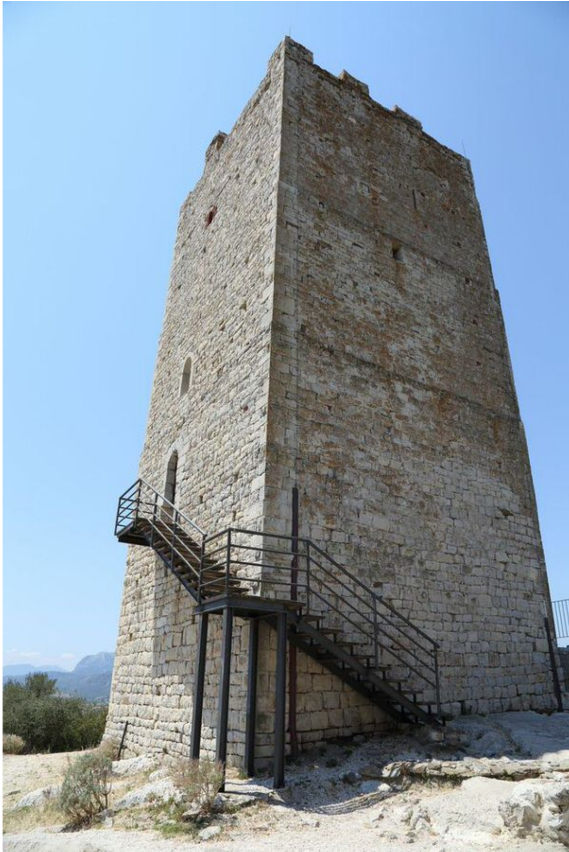
Abb. 6 - Turm, gesehen von der Nordostecke, mit den verschiedenen Öffnungen auf der Nordseite und der Ostseite.