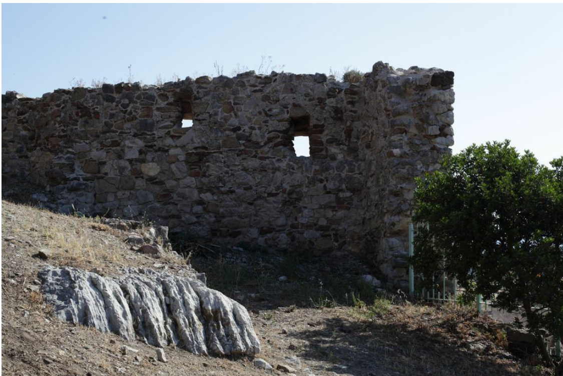
Abb. 3 - Öffnungen in der Ringmauer.