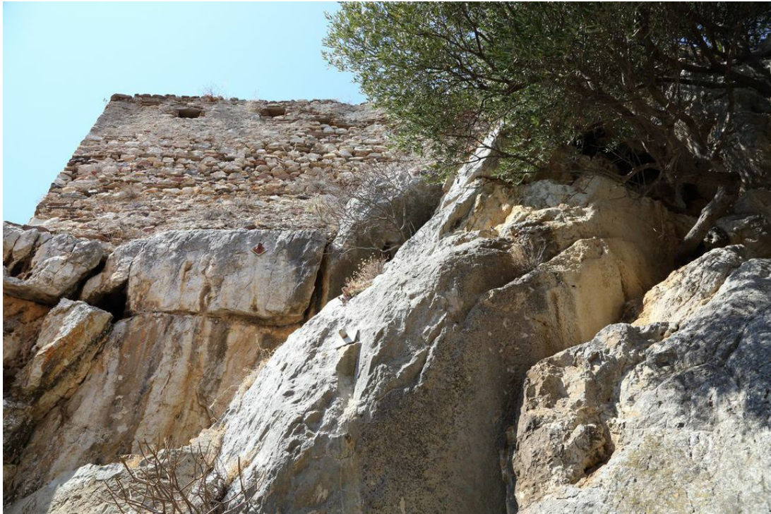
Abb. 2 - Detail der äußeren Ringmauer der Burg, direkt auf dem Fels errichtet.