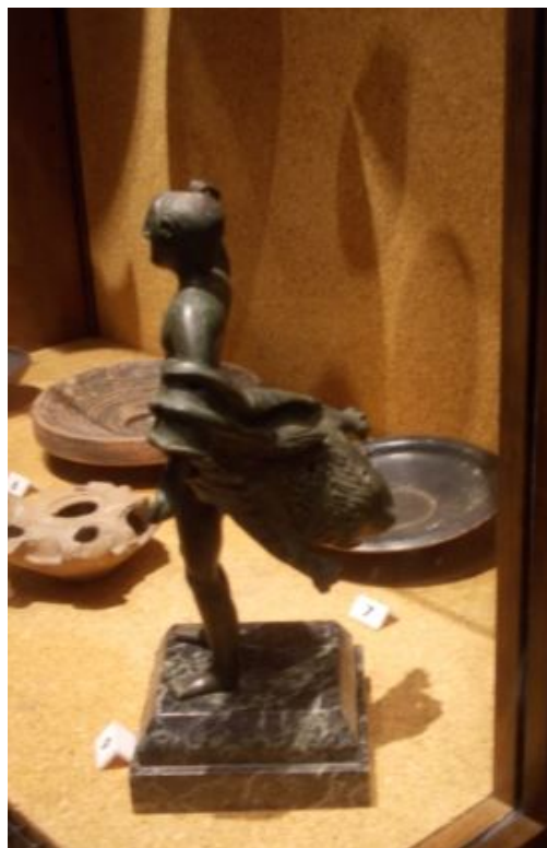
Abb. 4 - Die Herkules-Statuette in der Seitenansicht (Foto M. G. Arru).