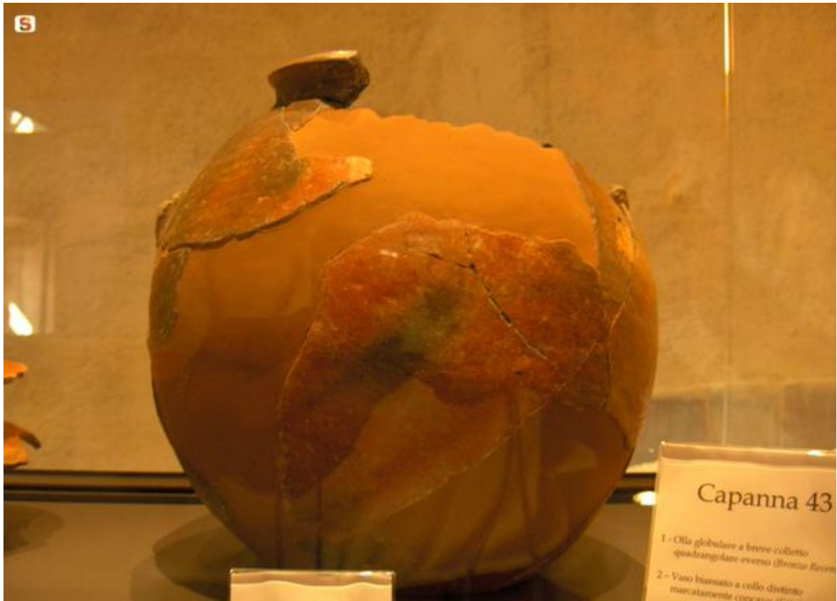
Abb. 3 - Kugelige Olla aus Casa Zapata, Barumini.