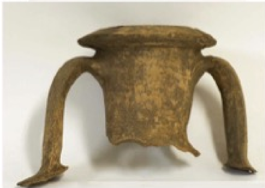
Abb. 3 - Antike griechisch-italische Amphore mit Verschluss aus Ton (aus: SANCIU 2012, Abb. 5).