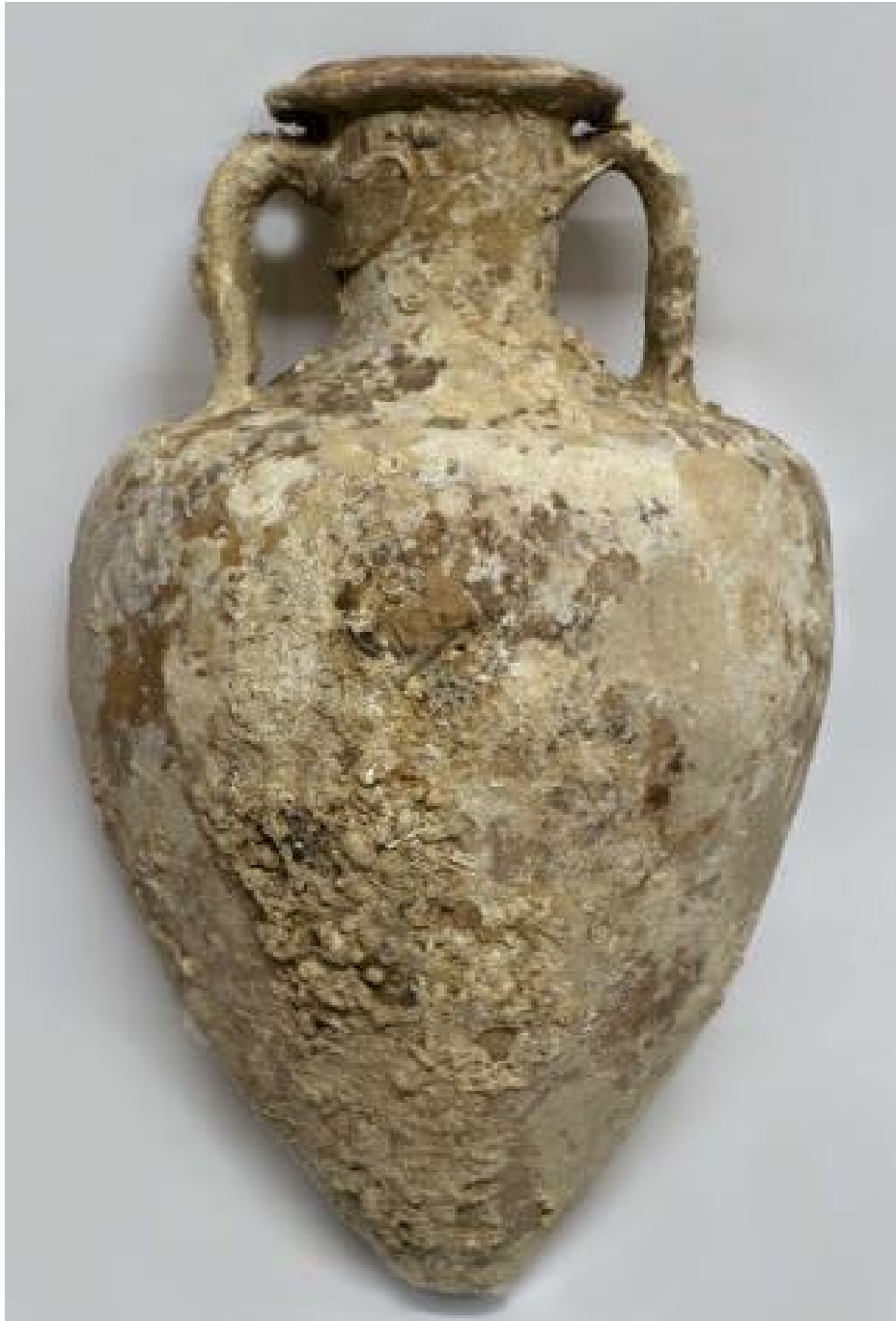
Abb. 4 - Griechisch-italische Amphore aus dem Meer von Ogliastro (aus: SANCIU 2012, Abb. 13).