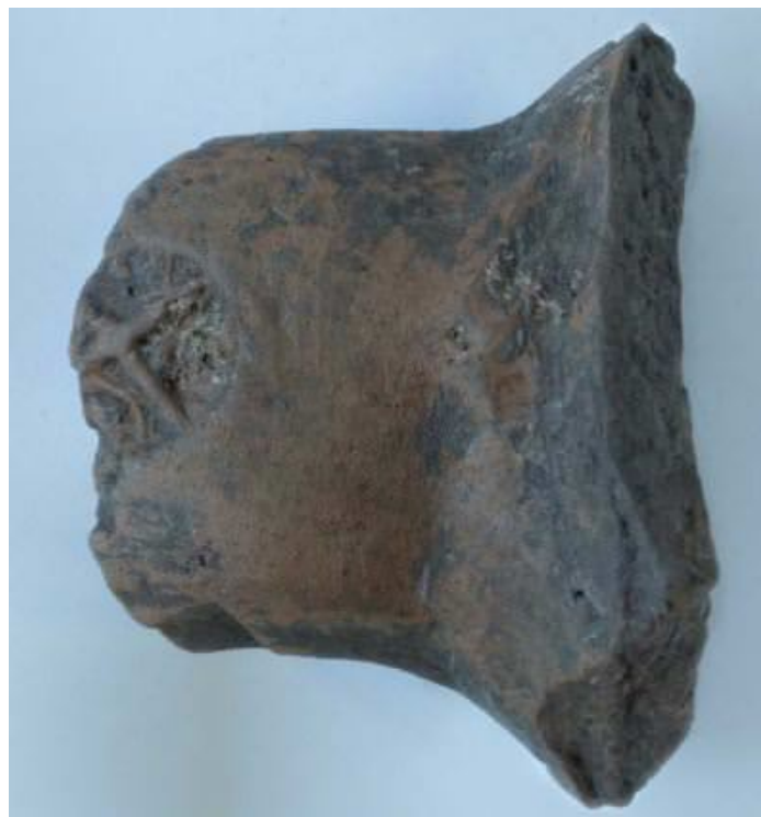
Fig. 3 - Henkel mit Siegel aus Posada (aus: SANCIU 2012, S. 178, Abb. 9).