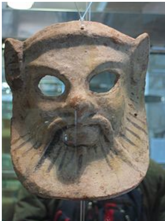
Abb. 4 - Silen-Totenmaske aus Sulky . Archäologisches Stadtmuseum „F. Barreca“.