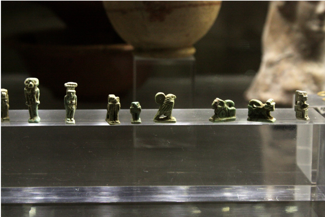
Abb. 3 - Amulett mit unterschiedlicher Form, aus Sulky . Archäologisches Stadtmuseum „F. Barreca“.