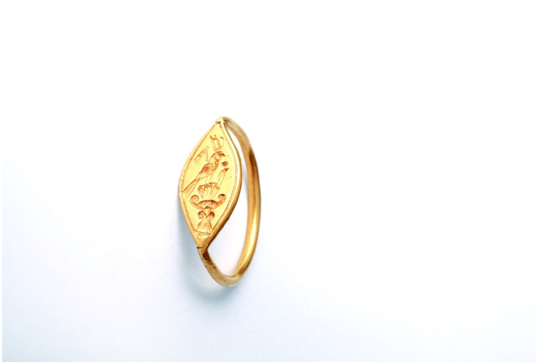
Abb. 7 - Die syrisch-palästinensische Küste mit den phönizischen Zentren und der Stadt Ugarit.

Der Verstorbene lag also - beerdigt oder eingeäschert - zwischen diesen Gegenständen in der unterirdischen Grabkammer, die oft mit Juwelen und Schmuckstücken dekoriert waren (Abb. 7) und der Tradition gemäß wurden duftende Harze und Salben auf den Verstorbenen aufgetragen, um den Verwesungsgestank zu überdecken und vielleicht auch, um die Verwesung zu verzögern.