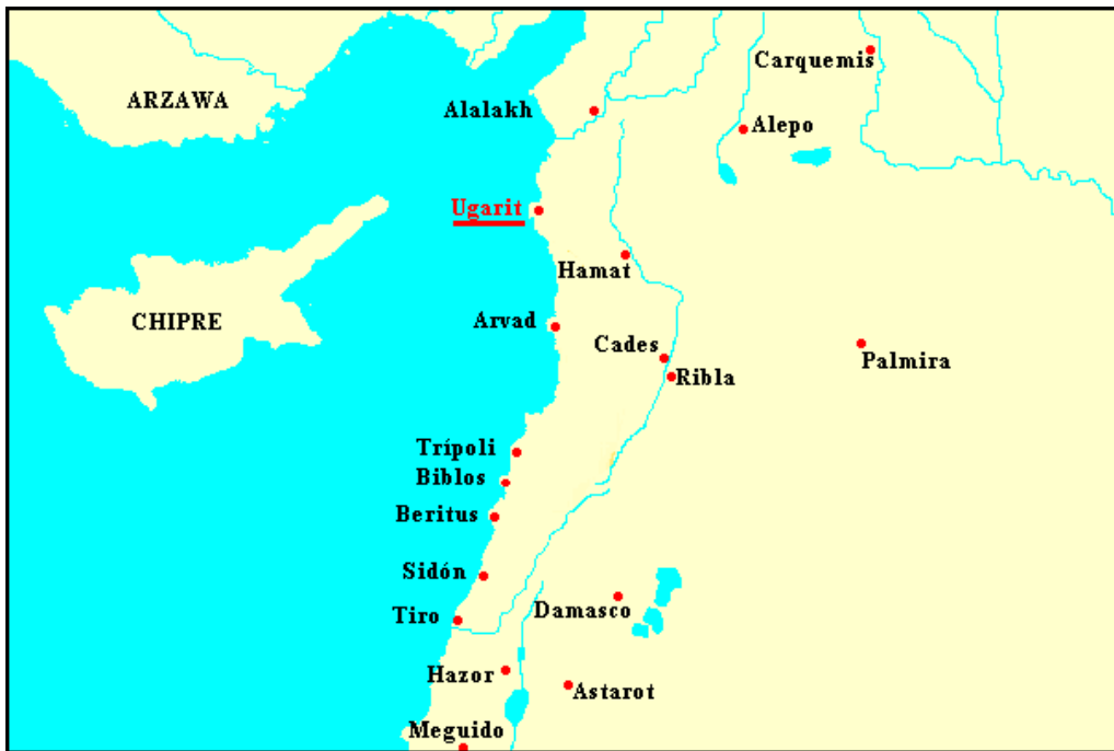
Abb. 8 - Die syrisch-palästinensische Küste mit den phönizischen Zentren und der Stadt Ugarit.

Eine kleine Tafel mit Inschrift, gefunden im Jahr 1973 in Ras Shamra (derzeitiger Name von Ugarit) zitiert ein Poem mit dem Titel „ Buch des Bestattungsofers “, das mit der Anrufung der „ Rephaim der Erde “ beginnt, die auch als alte Rephaim bezeichnet werden; dann fordert es dazu auf, den Tisch für einige dieser Geister zu bereiten, darunter auch einige alte Könige der Stadt. Es handelt sich somit um eine orientalische, syrische Version der Schutzgottheiten, die während des 2. Jahrtausends v. Chr. Gegenstand des Kults waren. Sie waren das orientalische Äquivalent der Dei Mani der römischen Welt und die Analogie wird durch eine lybisch/römisch-neopunische Inschrift aus dem 1. Jahrhundert n. Chr. belegt, die in El-Amrouni gefunden wurde und die den semitischen Begriff Rephaim mit Dii Mane übersetzt. Der Kult der Rephaim lebt jedoch auch im Kult der Heroen weiter: Es handelt sich um glorreiche Vorfahren, auf die die Entstehung eines Volkes zurückgeführt wird. Mit dem Begriff werden berühmte Verstorbene (Herrscher, Krieger und angesehene Persönlichkeiten), die nach ihrem Tod eine besondere Stellung im Reich der Toten annehmen. Das mythische Fundament des Kults dieser Persönlichkeiten besteht in der Geschichte des Gotts Baal , der - wie das den Tafel aus Ugarit hervorgeht - zu einem Kampf mit dem schrecklichen Mot gezwungen wurde, dem „Tod“, in der Unterwelt