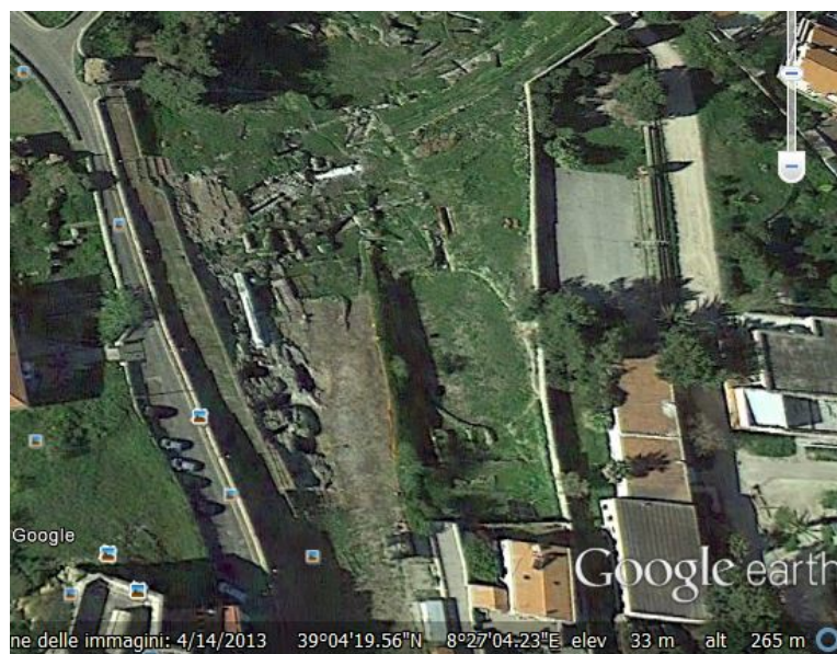
Abb. 3 - Die Ellipse des Amphitheaters von Sulky , gesehen von oben (Überarbeitung von C. Olinas, von Google Earth).

So wurde eine weite Ellipse angelegt, ausgerichtet auf der Nord/Süd-Achse (Abb. 3), deren Zuschauerraum aus verderblichem Material - wahrscheinlich Holz - bestand, unter Anwendung einer Technik, die auch in Nora angewendet wurde.