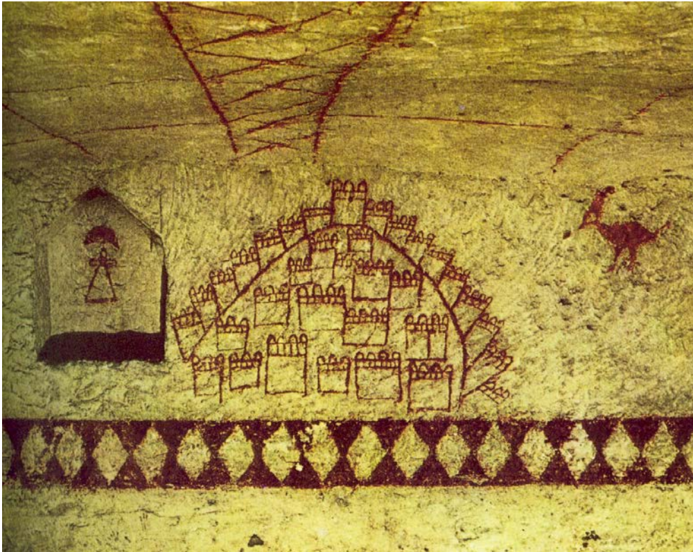
Abb. 2a - Rot bemalte Wand einer unterirdischen punischen Grabs von Gebel Mlezza, datierbar auf das 4. bis 3. Jahrhundert v. Chr. (aus: Moscati 1972, S. 449)