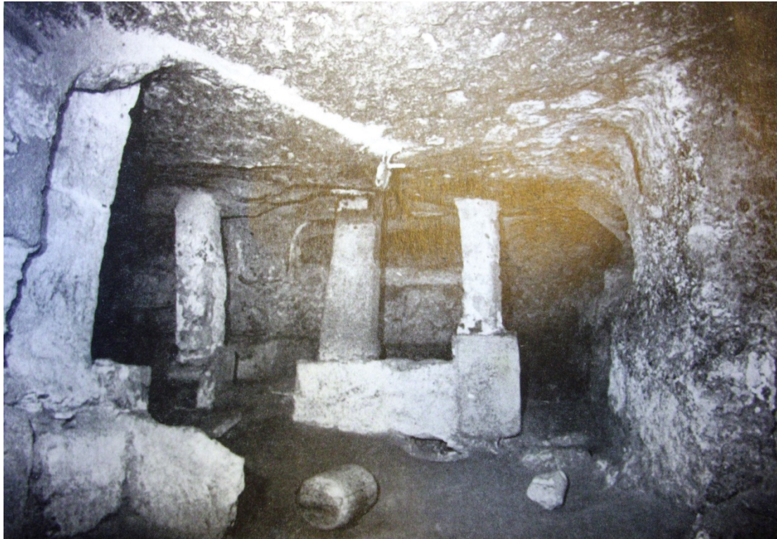
Abb. 5 - Das Baldachingrab im Raum G (aus: Porru 1989, Tafel XIII).

Neben diesen Räumen muss an die der so genannten Katakombe von Santa Rosa (Abb. 1) erinnert werden, bestehend aus den Räumen H und I, die in ihrer punischen Anlage nahezu intakt erhalten sind, da sie nicht abgeändert wurden: Die einzigen christlichen Elemente bestehen aus zwei Sarkophagen aus Mauerwerk, beide im Raum H, von denen der links des Eingangs traditionell für den Sarkophag der heiligen Rosa gehalten wird, die Mutter des heiligen Antiochos (Abb. 6).