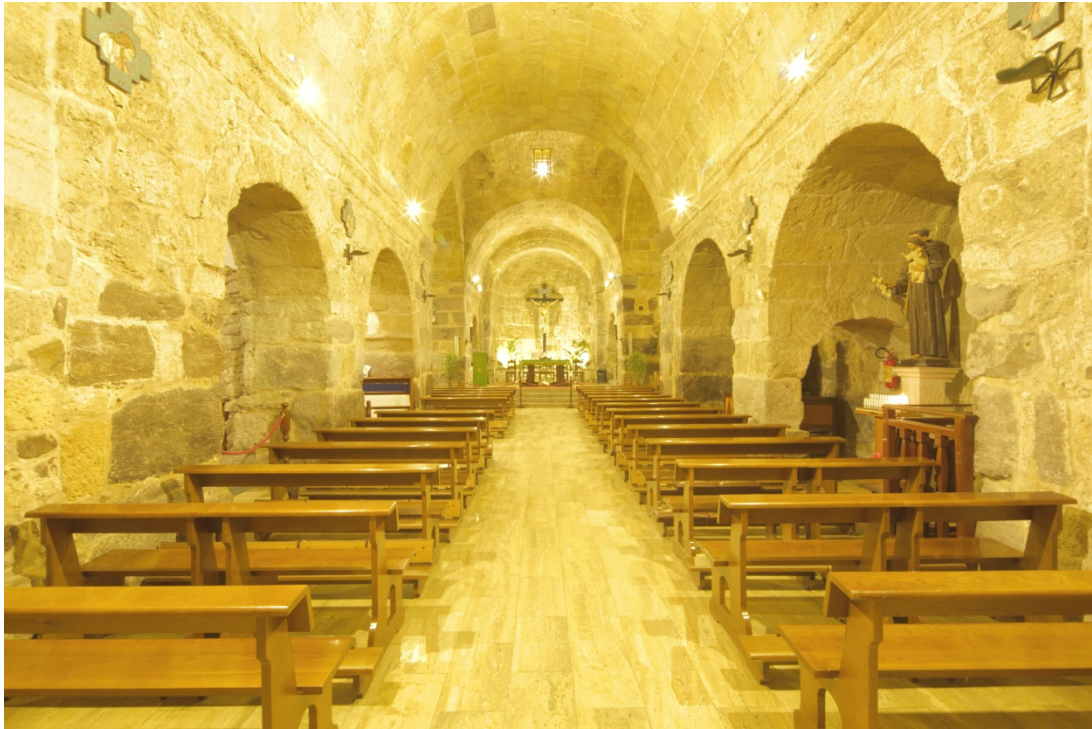
Abb. 7 - Die Martyrium -Basilika von Sant'Antioco.

Weitere frühchristliche Nutzungen von punischen Grabkammern in S. Antioco erfolgten im Bereich der Nekropole von Is Pirixeddus . In dieser kleinen Nekropole wurde ein Arco-solgrab gefunden, dessen Zuordnung ungewiss ist, ausgestattet mit Fresken mit christlichen Symbolen sowie einem idealisierten polychromen Bild des Verstorbenen (Abb. 8).