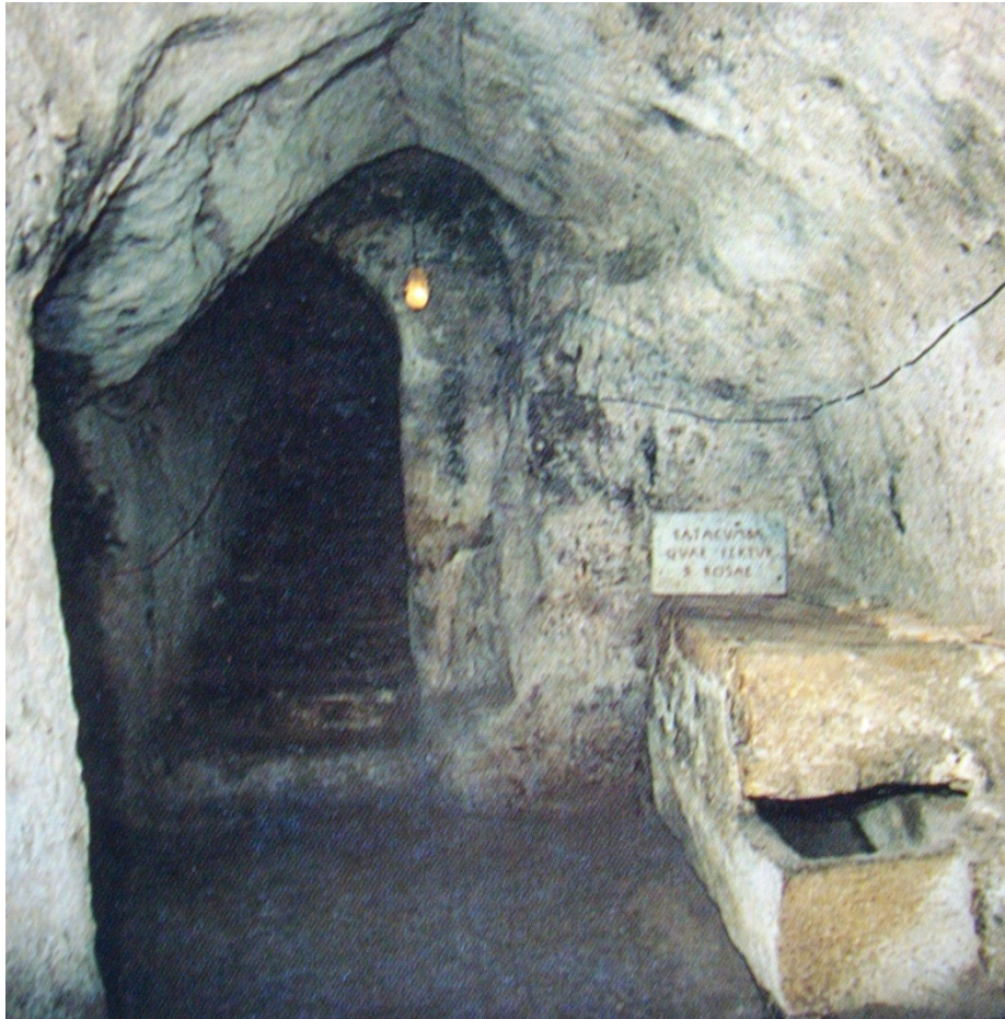
Abb. 6 - Eingang des Raums H der Katakombe von S. Rosa mit einem der Sarkophage links (aus: Porru 1989, Tafel XIII).

Der Zugang zur Katakombe Santa Rosa erfolgt heute durch den Dròmos des Raums H, ergänzt durch eine weitere kurze und enge Rampe vom Bodenbelag der Kirche aus.