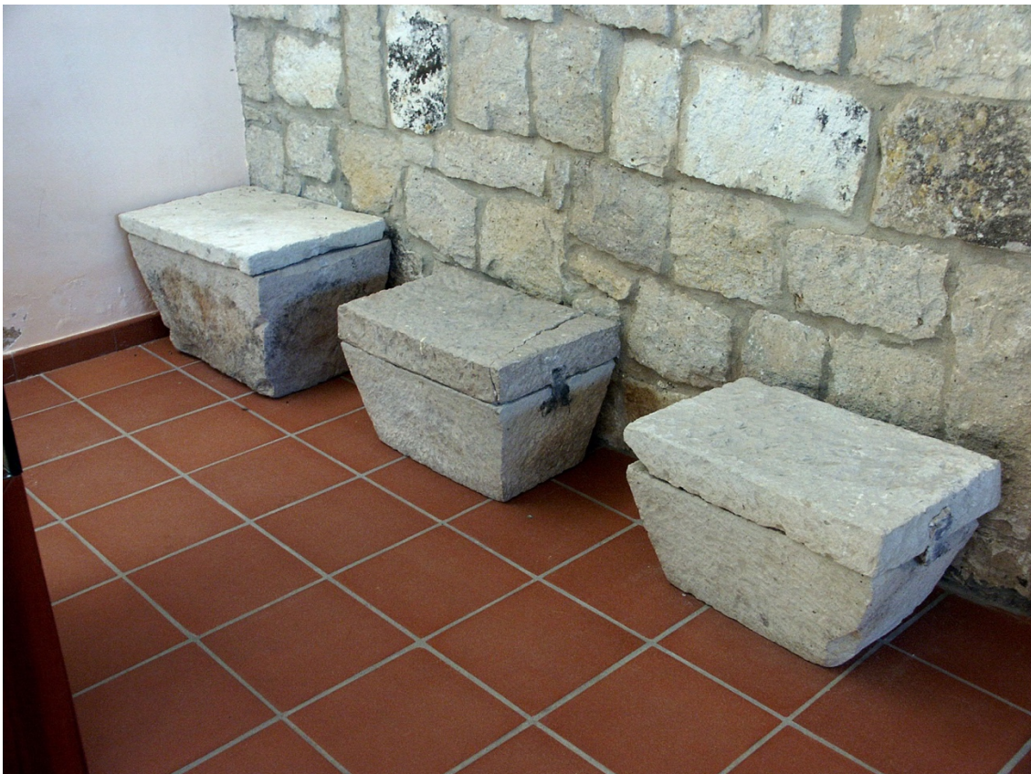
Abb. 4 - Urnen aus Stein mit Deckel, aus römischer Zeit. Archäologisches Stadtmuseum „F. Barreca“.