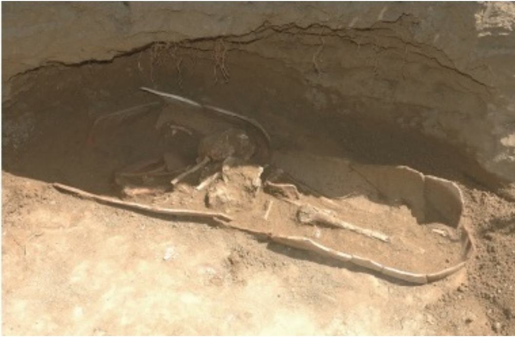
Abb. 3 - Enchytrismòs -Grab mit zwei zusammengefügt Amphoren für die Bestattung eines Erwachsenen, in der Nekropole von Agrigent, aus spätantike und mittelalterlicher Zeit (aus: Caminneci 2012, S. 123, Abb. 11).

In der punischen Zeit erscheint die Form des Enchytrismòs -Grabs gegen Ende des 6. Jahrhunderts v. Chr. und sie wird bis zu Beginn des 4. Jahrhunderts v. Chr. verwendet. Große handelsübliche Amphoren wurden zur Beisetzung von Kindern in einem eigenen Teil der Nekropole verwendet.