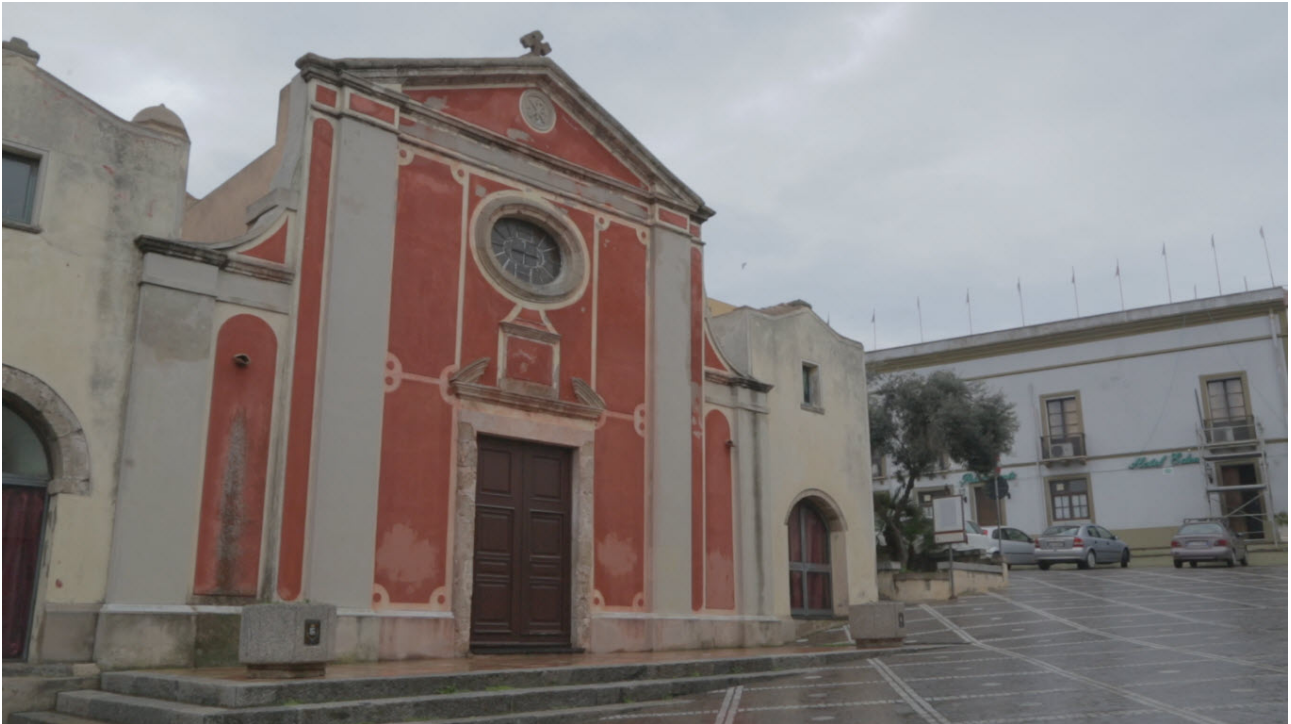
Abb. 5 - Die aktuelle Basilika von di Sant'Antioco, die aktuelle Fassade stammt aus dem 18. Jahrhundert

Die Epoche der byzantinischen Herrschaft begann offiziell im Jahr 534 n. Chr., nach dem Sieg des Feldherrn Belisar in Tricamarum bei Karthago (im heutigen Tunesien) gegen die Vandalen. Von diesem Zeitpunkt an gehörte Sardinien dem Oströmischen Reich an und wurde - zusammen mit Korsika und den Balearen - zu einer der 7 Provinzen des byzantinischen Afrikas, die Kaiser Justinian einrichtete; außerdem hatte Sardinien wie auch Numidien und Mauretanien, einen eigenen praeses und einen eigenen dux . Die Aufgabe des ersteren war die zivile Verwaltung, die des zweiten die militärische Verwaltung, mit Sitz in Fordongianus (dem antike Forum Traiani ), dem strategischen Zentrum für die Kontrolle der Barbarizinen und der Völker im Zentrum Sardiniens (Abb. 6).