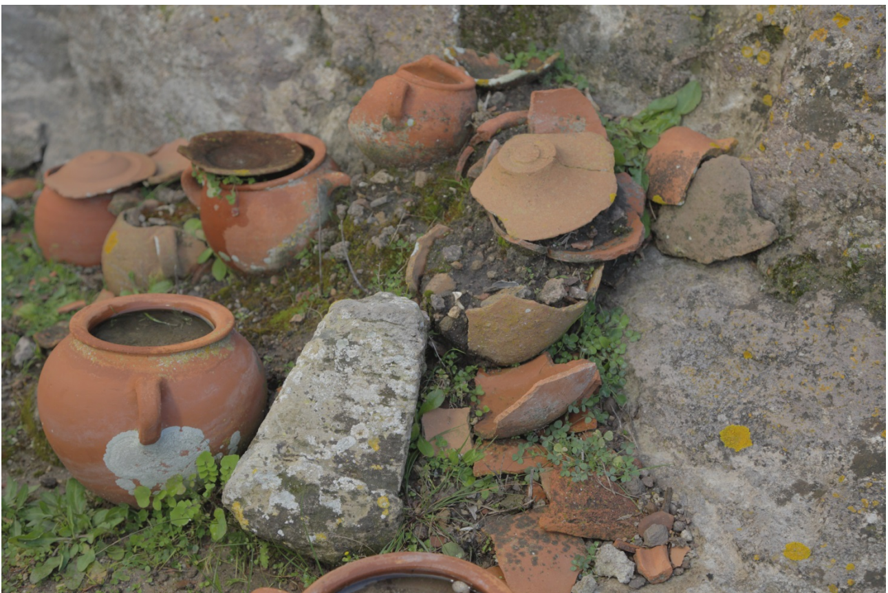
Abb. 4 - Detail der Gräber des Tophet von S'Antioco , mit einem Bethel.

Der Wechsel von der punischen zur römischen Herrschaft führte für die Bewohner der Insel nicht zu einer Entwurzelung von ihren Traditionen und ihrer Kultur, deren Wurzeln bereits seit mehreren Jahrhunderten phönizische Elemente aufweisen. Die Römer integrierten sich in die eroberten Völker und respektierten ihre Sprache sowie ihre Bräuche. In Sulky wurden die punischen Kammergräber ohne Unterbrechung noch ca. zweihundert Jahre weiter genutzt und der Tophet wurde noch in der republikanischen Zeit genutzt (Abb. 4).