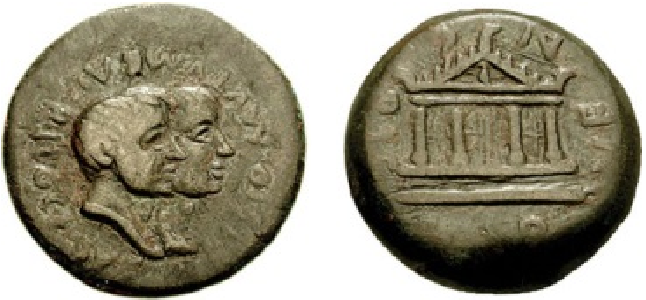
Abb. 2 - Eine aus Karthago stammende Münze, auf der zwei Sufeten des Jahres 40 oder 38 v. Chr. Dargestellt sind. Aristo und Mutumbal Ricoce, vielleicht die beiden Sufeten aus Karales und auf der Rückseite der Templum Veneris