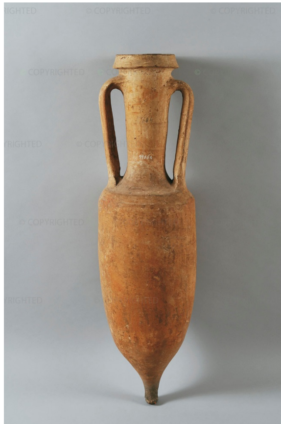
Abb. 5 - Amphore vom Typ Dressel I.

Im Laufe der Zeit erholte sich die Stadt dann wieder zu neuem Glanz und spielte eine wichtige Rolle im Handel mit Metallen, die im Iglesiente-Gebiet abgebaut wurden: Diese Aktivität führte zur Bezeichnung Insula Plumbea ("Blei-Insel"). Die Aufnahme Sardinien in die Sphäre des römischen Handels in der Zeit der römischen Republik führte auch zum Import von Erzeugnissen, vor allem von Keramik, darunter Amphoren (vor allem vom Typ Dressel I ), die als Behälter für etruskischen und kampanischen Wein nach Sardinien kamen (Abb. 5). Zusammen mit dem Wein und den Amphoren kam auch schwarz glasierte, etruskische und mittelitalische Keramik nach Sardinien. Diese Formen wurden auch imitiert oder sie wurden zum Modell für eigene Weiterentwicklungen, die eine gewisse Originalität aufweisen.