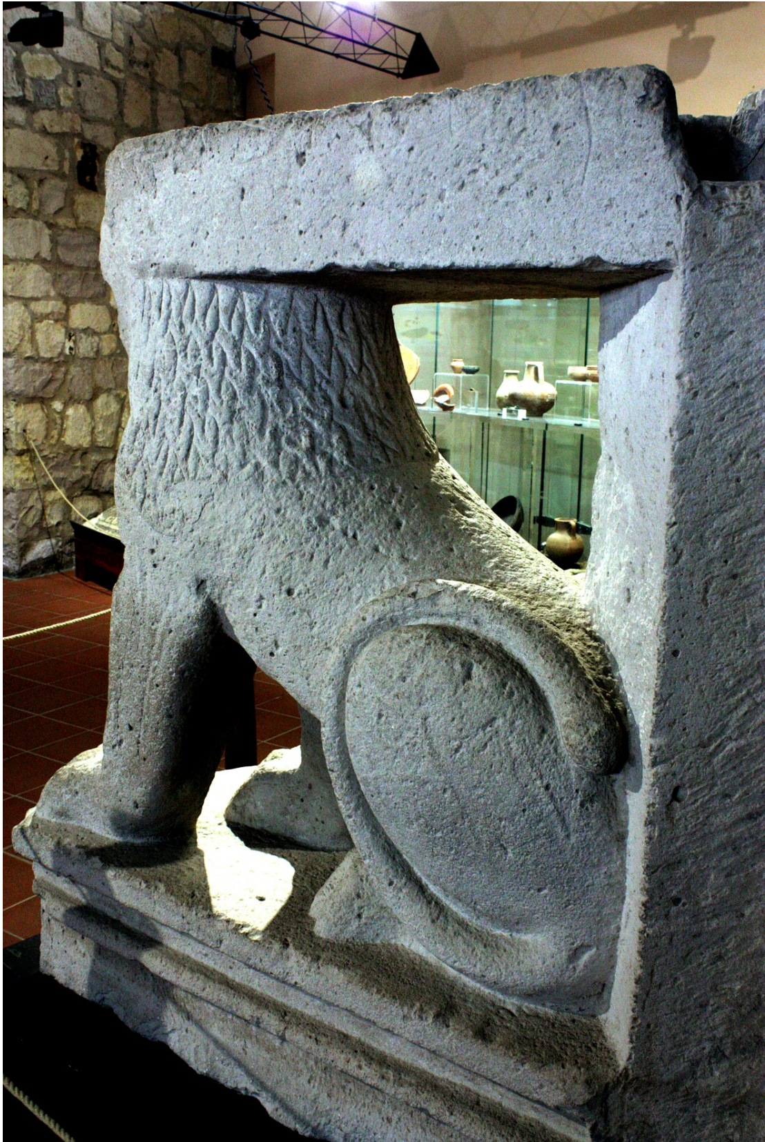
Abb. 3 - Detail eines der Löwen: sichtbar sind das Muster der Mähne, die Muskulatur des Schenkels und die architektonischen Elemente, die zur Skulptur gehören.