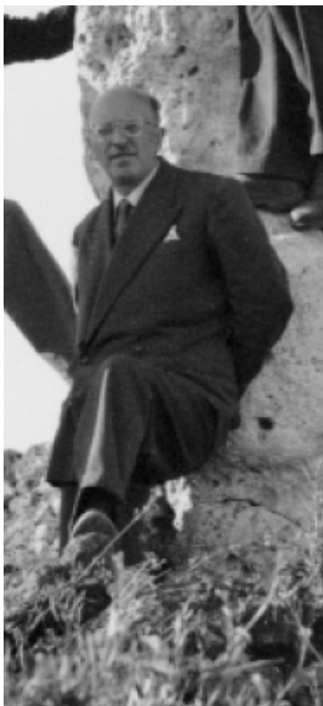
Abb. 1 - Gennaro Pesce auf einem Bild aus dem Jahr 1942

Im Jahr 1956 begannen in Sant'Antioco, dem antiken Sulky , die Grabungsarbeiten im Bereich des Tophets und der unterirdischen Nekropole. Die Arbeiten wurden vom Superintendenten für Antike von Cagliari, Gennaro Pesce (Abb. 1), sowie vom Inspektor Ferruccio Barreca (Abb. 2) geleitet, in Zusammenarbeit mit dem Hauptassistenten Peppino Lai.