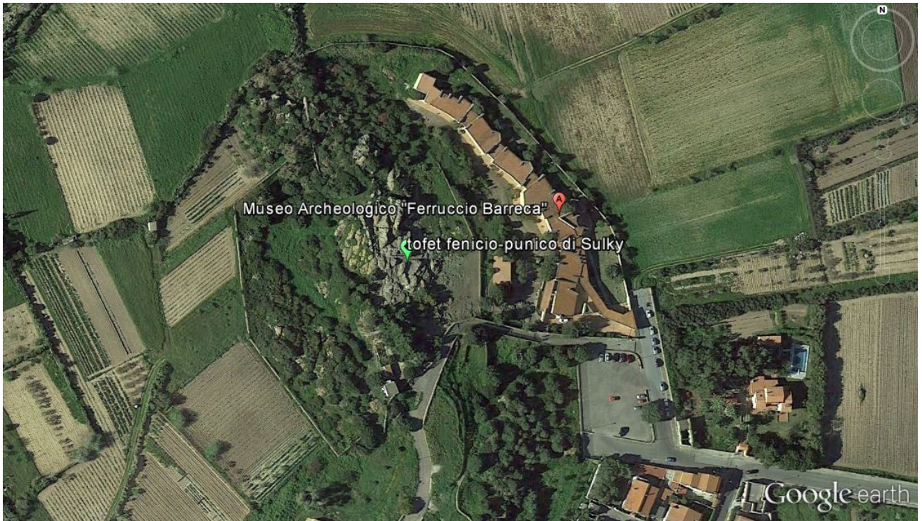
Abb. 5 - Das Archäologische Museum, gesehen von oben. Links des Gebäudes, der Tophet.