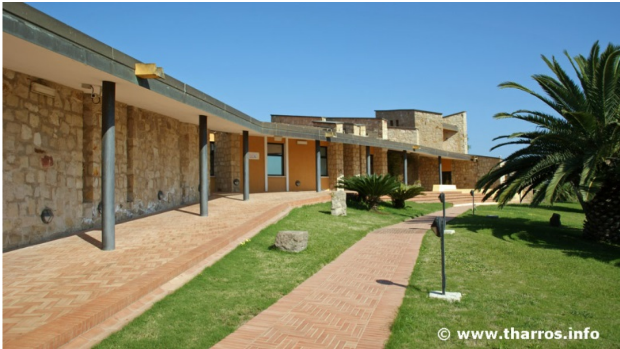
Abb. 3 - Das Äußere des aktuellen kommunalen Archäologischen Museums von Sant'Antioco.

Das aktuelle Museum besteht aus 4 Sälen, von denen der erste in die Zivilisationen einführt, die es auf der Insel Sant'Antioco im Laufe der Zeit gegeben hat; zum Teil ist er den Ursprüngen der menschlichen Ansiedlung ab der Prä- und Protohistorie gewidmet. Der zweite bis vierte Saal der Ausstellung betrifft im Wesentlichen die Funde im Bereich der Nekropole und des Tophet, bereichert durch Erklärungstafeln und plastische Rekonstruktionen (Abb. 4). Von großem Interesse ist auch das Video, das eine Rekonstruktion des hölzernen Sarkophags von Grab Nr. 11 bietet.