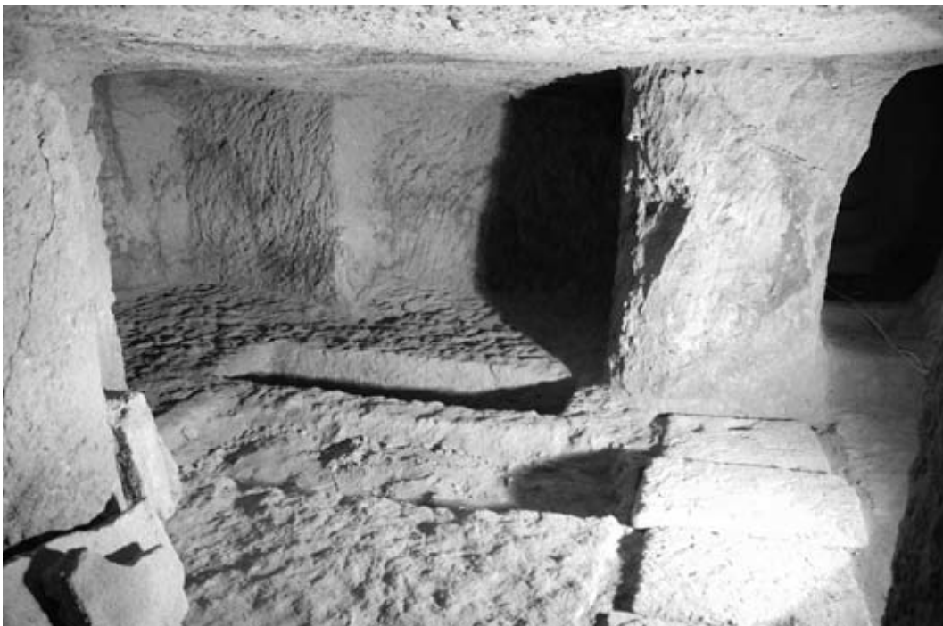
Abb. 2 - Das Innere des Grabs Steri 2 mit Hervorhebung der beiden Gruben (aus: Muscuso, Pompianu 2010, S. 040, Abb. 7).

Der Korridor und der Treppenabsatz führen zum Zugang zur Grabkammer, die - wenn sie nicht ausgeraubt worden ist - in situ einen Verschluss mit einer Platte aufweist, die bei den Grabungsarbeiten ausgespart wurde (siehe Abb. 1) und die mit Lehm versiegelt wurde. Die Grabkammer konnte auch mit Steinen oder Lehmziegeln verschlossen werden. Die Grabkammer weist immer eine unregelmäßige viereckige Form auf und während die älteren Gräber eine einfache Zelle ohne Unterteilung mit Eingang auf der kurzen Seite aufweisen, die im Durchschnitt 4 x 5 Meter groß ist, weisen die jüngeren normalerweise eine Trennwand auf, deren Ende zum Eingang weist und die oft mit einfachen oder komplexen geometrischen oder figurativen Motiven verziert sind, wie im Fall der Hochrelief mit menschlicher Figur in natürlicher Größe im ägyptisierenden Stil, die wahrscheinlich den Gott Baal Addir darstellen, den Herrn der Unterwelt (Grab 7). Die Grabkammern folgen nie einem präzisen Standard und weisen unterschiedliche Anpassungen an den Fels auf, in den sie gegraben wurden; einige umfassen auch Grubengräber, wie im Fall von Grab Steri 2 (Abb. 2).