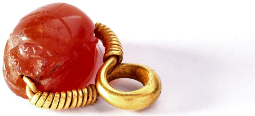
Abb. 3 - Skarabäus aus Karneol. Archäologisches Gemeindemuseum "F. Barreca"

über dem Körper einen Bogen bildet, der dem Profil des Ovals folgt und in einer Frucht oder Blüte vor dem Arm mit der offenen rechten Hand, im Begriff, sie zu fassen (Abb. 4). Die Ikonographie entspricht - wie gesagt - dem griechisierenden Stil, aber die punischen Skarabäus weisen auch viele Bilder und Szenen im ägyptischen, orientalisierenden und etruskischen Stil auf, sowie auch gemischte Typen, bei denen figurative Elemente verschiedener Kulturen gemischt werden.