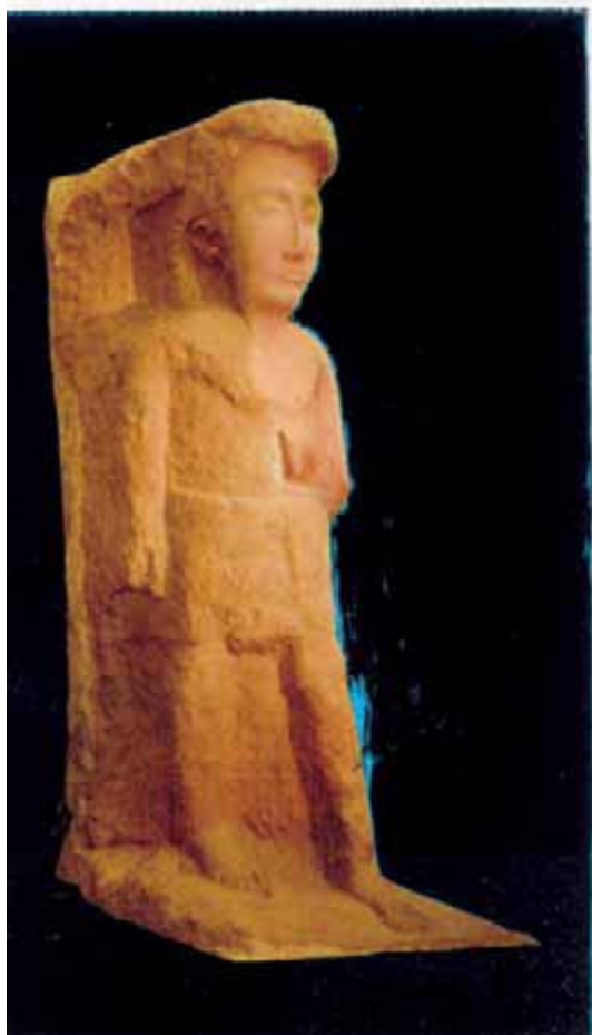
Abb. 7 - Relief aus der Grabkammer 7 der Nekropole von Sant'Antioco, entdeckt im Jahr 1968 (aus: TRONCHETTI 1989, Abb. 3, S. 10).

wurde, das bis vor einigen Jahrzehnten im alten Archäologischen Nationalmuseum von Cagliari ausgestellt wurde (Abb. 7).