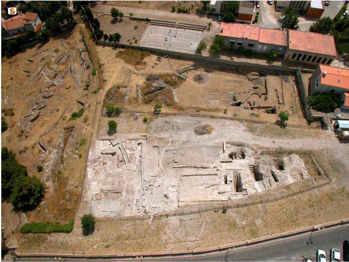
Abb. 2 - Ansicht des Sektors der Nekropole von Is Pirixeddu von oben

Die Gräber können auf die punische Zeit datiert werden, zwischen Ende des 6. Jahrhunderts und Ende des 4. Jahrhunderts v. Chr., in der Periode, in der sich die Herrschaft der Karthager auf der Insel durchsetzte. Es wurde bereits erwähnt, dass die unterirdischen Gräber während der römischen und der frühchristlichen Zeit wieder genutzt wurden, während von der vorausgehenden Nekropole aus der phönizischen Zeit nur vereinzelte Reste erhalten sind, darunter der Fund von Überresten von Skeletten in der heutigen Via Perret, zusammen mit einem Krug, der auf die Mitte des 7. Jahrhunderts v. Chr. datiert werden kann. Die phönizische Nekropole befand sich ca. 400 Meter vom archaischen Zentrum und ca. 100 Meter von der antiken Küstenlinie entfernt.