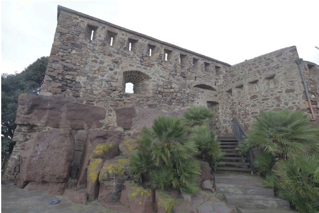
Abb.1 - Savoyisches Fort von Su Pisu (Foto von Unicity S.p.A.).

Diese unterirdischen Überreste wurden dann in der römischen und der frühchristlichen Zeit wieder genutzt und ab dem 18. Jahrhundert dann teilweise von ärmeren Bevölkerungsschichten von Sant'Antioco auch bewohnt, als sich der antike Ort wieder belebte, nach einer Epoche, in der er aufgrund gefährlicher Piratenüberfälle unbewohnt war. Die systematische Erforschung des Territoriums ist noch nicht abgeschlossen, da sich ein wesentlicher Teil der Nekropole unter dem heutigen Ortskern befindet. Auf der Grundlage der Kenntnisse aus einem Jahrhundert archäologischer Untersuchungen kann die Hypothese aufgestellt werden, dass die ursprüngliche Ausdehnung dieses Bestattungskomplexes mehr als 6 Hektar betragen hat und, dass er zumindest 1.500 Gräber umfasste (Abb. 2-3).