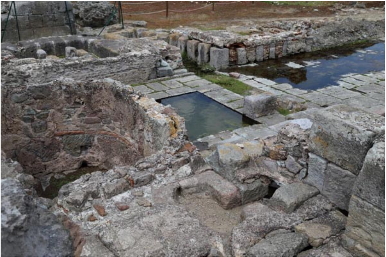
Abb. 5 - Die Nebenräume der Thermes I

An der Nord- und Südseite wies das Schwimmbecken Korridore mit Portikus auf, während sich an der kurzen Seite im Westen Zisternen und Nebenräume befanden (Abb. 5).