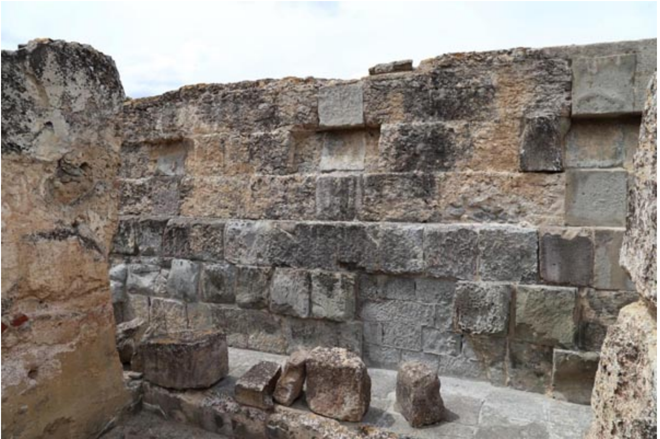
Abb. 2 - Die gewaltige Struktur aus Opus Quadratum der Thermen I.

Die Thermen entstehen ursprünglich im Zusammenhang mit natürlichen heißen Thermalquellen mit Kurwirkung, was auch durch zahlreiche Widmungen an die Nymphen sowie an den Gott Äskulap belegt wird. Das Herz des Gebäudes ist das große Schwimmbecken ( Natatum , Abb. 3-4), in dem das 54 °C heiße Wasser mit kaltem Wasser temperiert wurde.