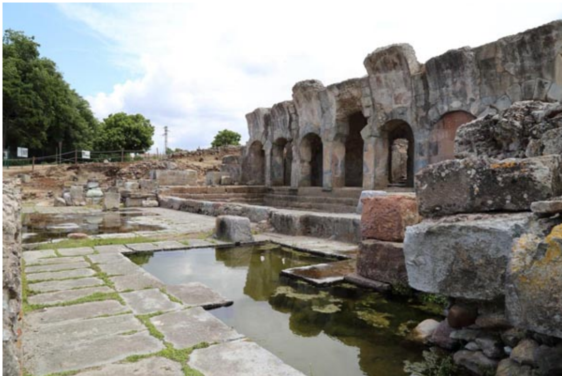
Abb. 4 - Das Natatium , gesehen von den angrenzenden Räumen auf der Nordseite.