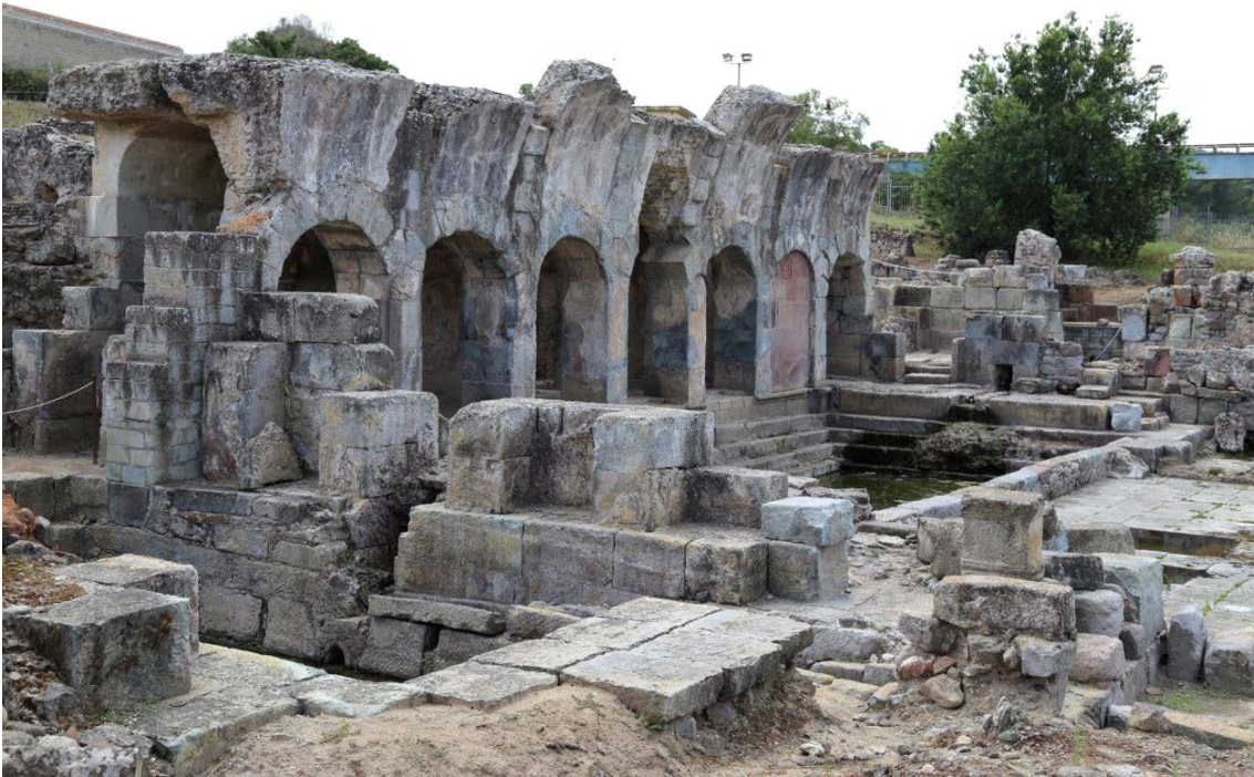
Abb. 3 - Der Kern der Thermen I: das Natatium und im Vordergrund das Nymphäum.