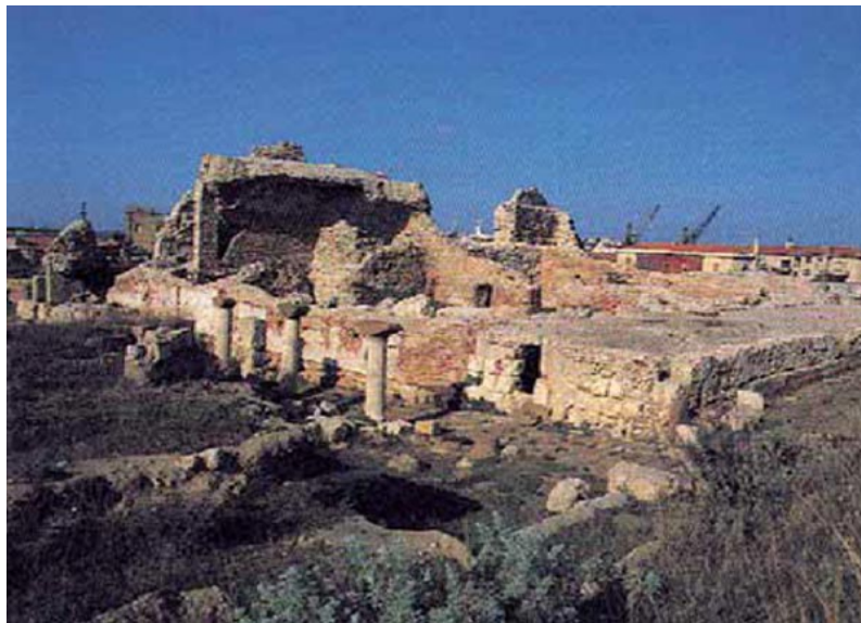
Abb. 2 - Porto Torres, die so genannten Thermen Palazzo di Re Barbaro

Die Thermen sind ein konstantes Element der römischen Städte, in denen sie eine wichtige Position einnehmen (Abb. 2-4), und sie sind auch auf dem Land sehr verbreitet, sowohl in den Villae, als auch zur Aufwertung kleinerer Siedlungen.