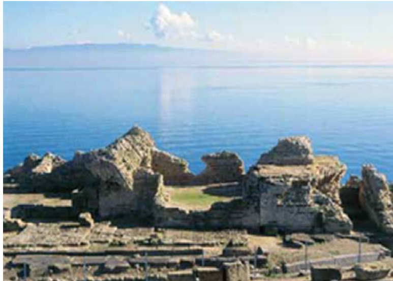
Abb. 4 - Tharros, Terme Convento Vecchio (aus: Acquaro-Finzi 2004, S. 55).