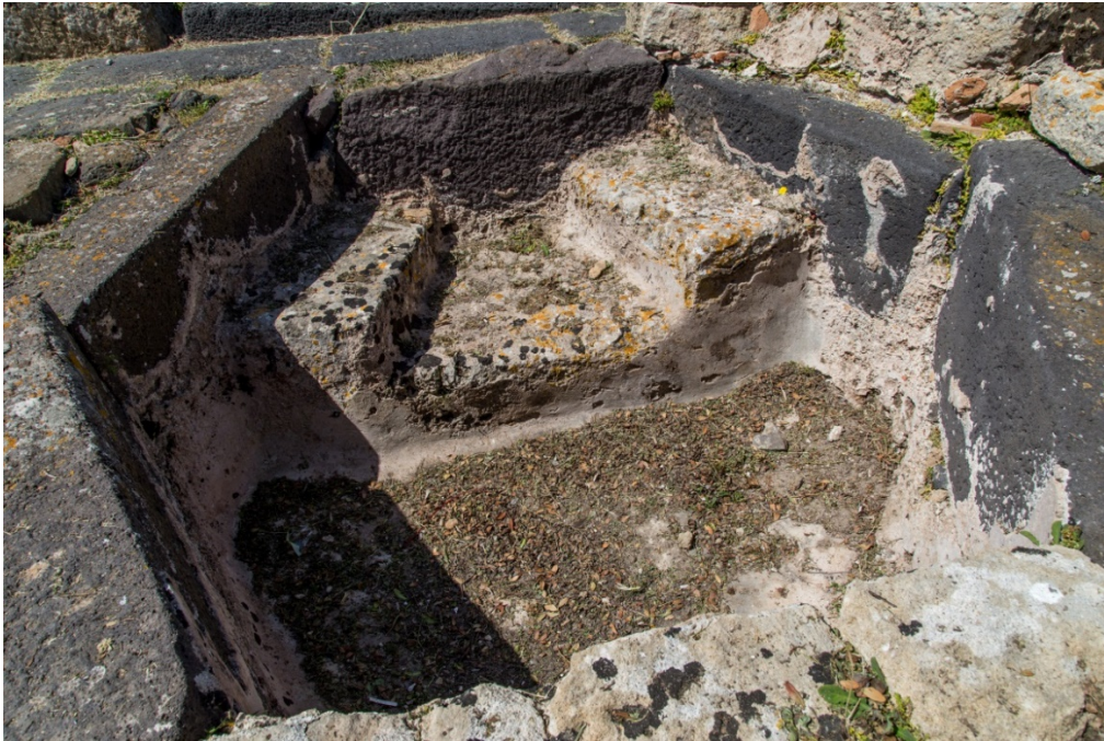
Abb. 5 - Detail des Sitzes des Taufbeckens

Der Bodenbelag der kleinen Taufaula und die Struktur des Beckens bestehen aus Basaltplatten, die denen des Straßenbelags recht ähnlich sind und sie stammen offensichtlich vom Abriss eines nicht mehr genutzten Straßenabschnitts (Abb. 6).