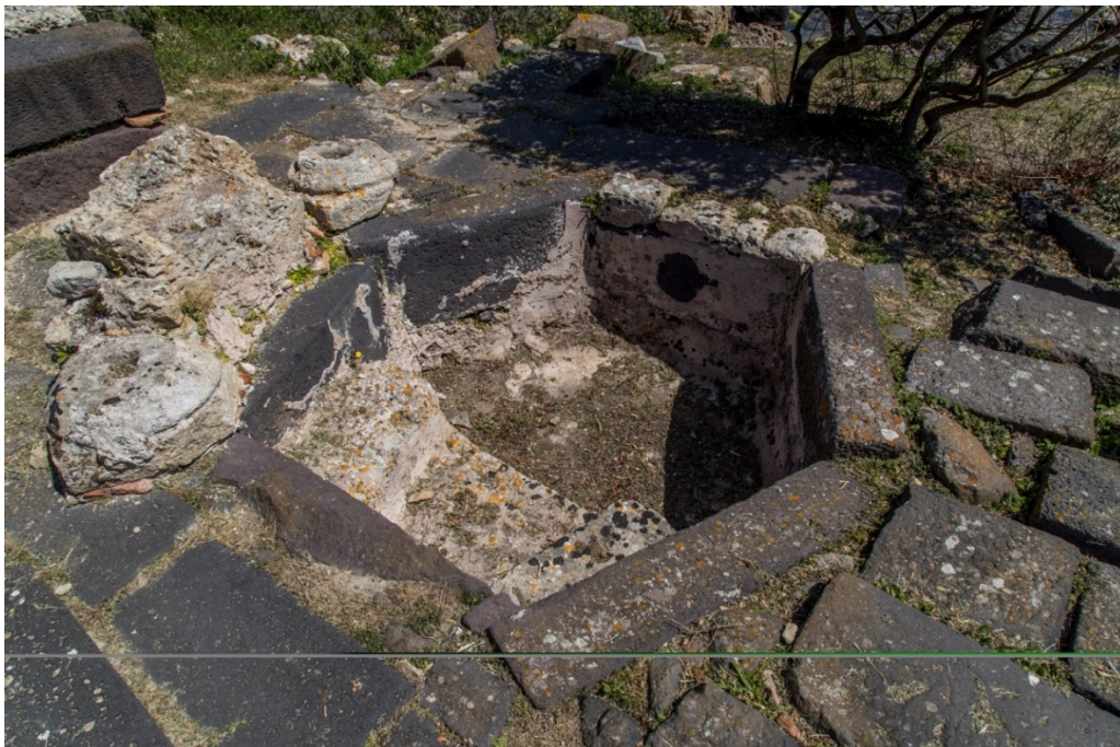
Abb. 3 - Das Baptisterium aus dem 6. Jahrhundert n. Chr.

Der Bau für diese liturgischen Zweck wies im Nordosten ebenfalls ein Apsis auf und enthielt ein Tauchbecken mit hexagonaler Form (Abb. 3).