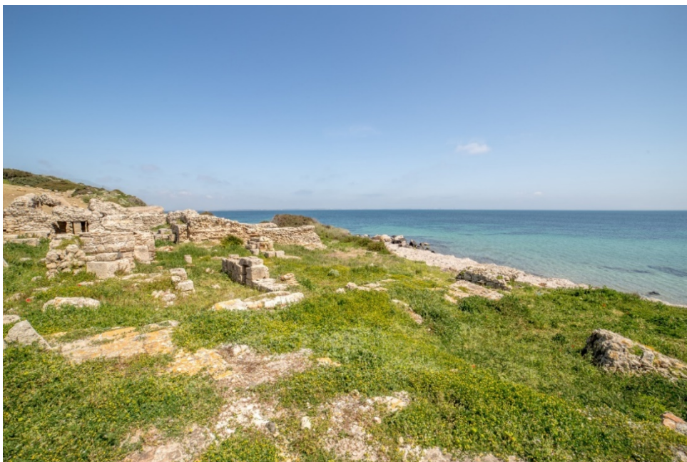
Abb. 4 - Die Thermen Nr. 1, gesehen von Süden.

Die Errichtung der Thermen Nr. 1 wird allgemein auf den Lauf des 2. Jahrhunderts n. Chr. angesetzt. (Abb. 4-8).