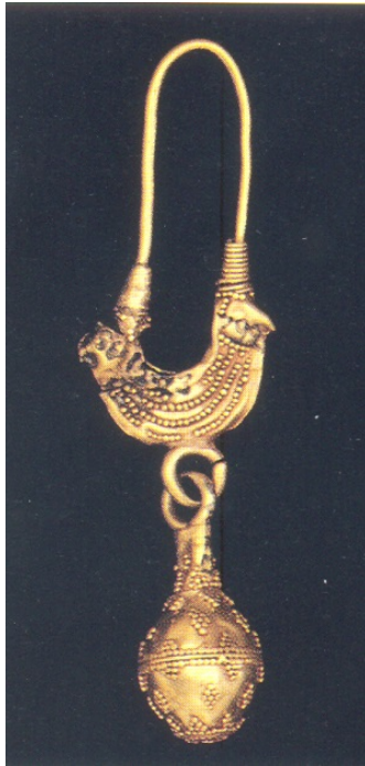
Abb. 4 - Goldener Ohrring mit elliptischer Schlaufe, einem Körper mit Vogelprotomen sowie einem Anhänger mit stark ausgeprägter Kugel (5. Jahrhundert v. Chr.) (aus: AA.VV. 1990, Abb. 4).