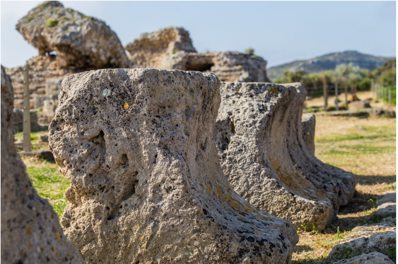
Abb. 6 - Architektonische Dekorelemente mit ägyptischer Kehle vom Tempel mit Inschriften.

Der zuvor beschriebene Komplex aus kleinem Tempel und Portikus wird auf das 2. Jahrhundert v. Chr. datiert, aber das Vorhandensein von wiederverwendeten Blöcken aus Sandstein, von denen einige eine Inschrift in punischen Buchstaben „... hat seine Stimme erhört ... “ aufweisen, führt zur Annahme eines vorausgehenden punischen Sakralbaus, der verloren gegangen ist.