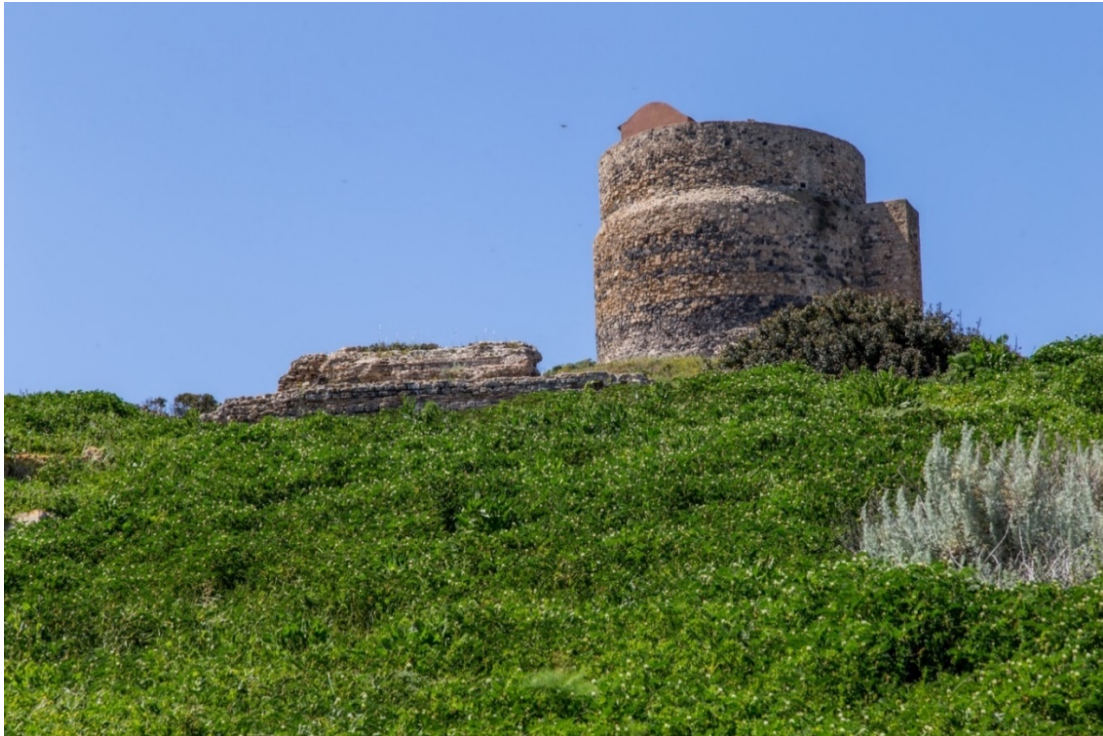
Abb. 3 - Die Überreste des Tempels mit Inschriften am Hang, der vom Turm San Giovanni dominiert wird

Der kleine Tempel K weist eine rechteckige Form auf und er ist über 5 Stufen zugänglich; an der Front wies er zwei Pilaster in antis auf (Abb. 4-5).