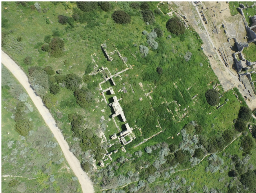
Abb. 2 - Der Bereich des Tempels mit Inschriften