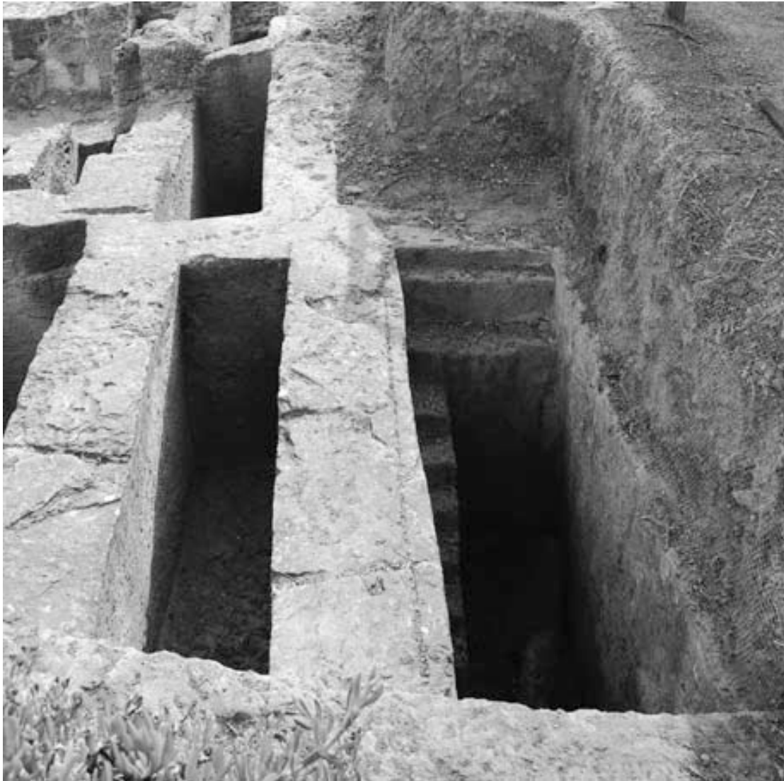
Abb. 5 - Die südliche Nekropole. Das Foto zeigt die Stufen an einer Wand des rechten Schachts

Die jüngsten Untersuchungen dienten der Gewinnung der architektonischen Daten der Gräber, während zu den Grabbeigaben nur typologische Studien vorgenommen werden konnte, da die Zusammensetzungen der Grabbeigaben größtenteils verlorengegangen ist und die erhaltenen wenig glaubwürdig sind. Es ergibt sich jedoch das Bild einer sehr reichen Stadt, die im Zentrum von Handelsbeziehungen mit verschiedenen Regionen des Mittelmeerraum stand.