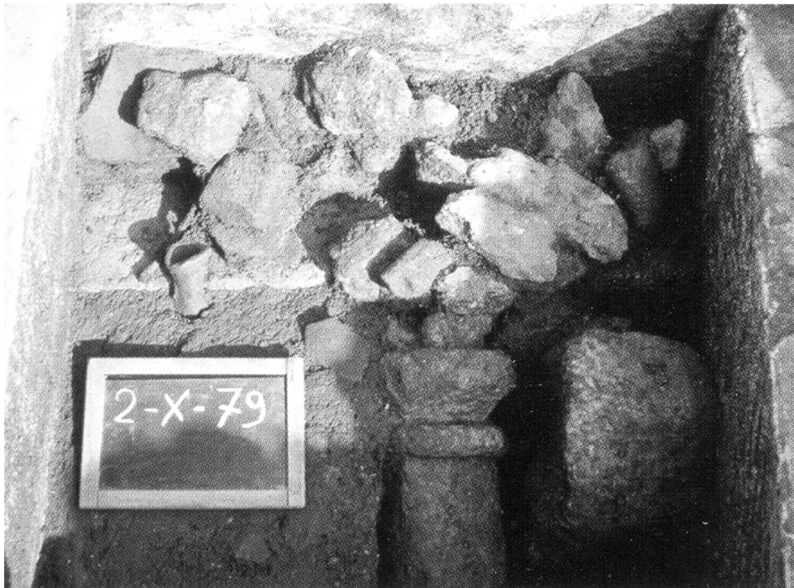
Abb. 4 - Teil der Votivgabe des punischen Sacellums von Cuccuru S'Arriu

Insgesamt kann gesagt werden, dass die punische Präsenz im Territorium bestimmten Kriterien folgten, die auf die bestmögliche Nutzung des Lands und der Ressourcen ausgerichtet waren. Die Rationalität der Verteilung der Siedlungen führte dazu, dass sie auch während der gesamten Zeit der römischen Republik bis zum radikalen Wandel in der Kaiserzeit genutzt wurden.