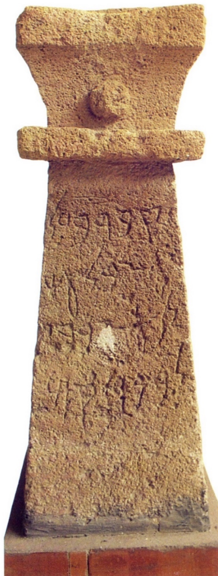
Abb. 6 - Grabstein aus Tharros aus dem 4. Jahrhundert v. Chr. (aus: UBERTI 1986, S. 115)

Die Grabsteine wurden außer im Tophet auch in den Nekropolen verwendet, wie dieses Exemplar belegt, wahrscheinlich aus der nördlichen Nekropole von Tharros, mit einer Inschrift "Grab von B'LZBL Gattin von ZRBL Sohn von MQM", datierbar auf das 4. Jahrhundert v. Chr. (Abb. 6).