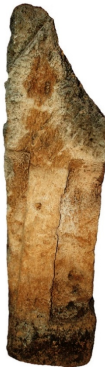
Abb. 3 - Punische Stele mit Bethel aus dem 5. Bis 4. Jahrhundert v. Chr. (Oristano, Antiquarium Arboreense ) (Foto von Unicity S.p.A.)