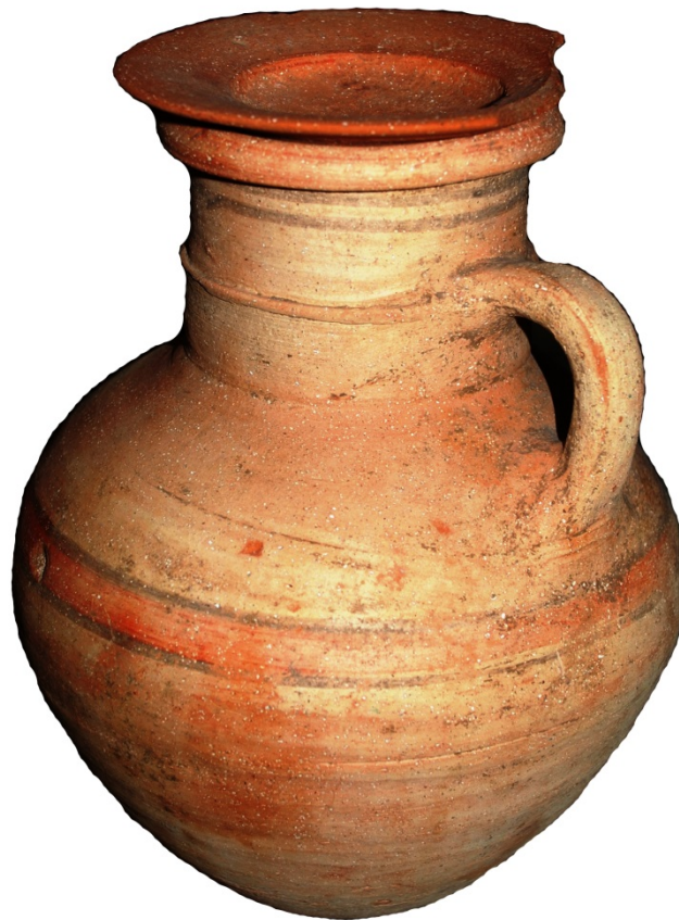
Abb. 2 - Krug mit zylindrischem Hals aus dem Tophet (Oristano, Antiquarium Arboreense )

Dieses Gefäß stellt eine Weiterentwicklung einer phönizischen Form da, die ab dem 8. Jahrhundert v. Chr. belegt ist (Abb. 3) und deren charakteristische Konstante das Fehlen des Fußes, der zylindrische Hals mit einem Einschnitt und ein vergrößerter Rand ist; das Dekor ist, wo vorhanden, sehr schlicht, beschränkt auf einen oder mehrere farbige Streifen auf dem Körper (Abb. 4); bei den ältesten Exemplaren fehlt das Dekor vollständig.