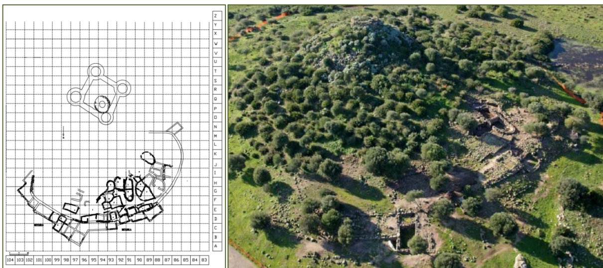
Abb. 1-2 - Planimetrie und Foto der Nuraghe Sirai von oben (PERRA 2012, Abb. 1-2)

Die Nuraghe Sirai ist ein Monumentalkomplex, der für die Umgebung von großer Bedeutung war. Er befindet sich ca. einen Kilometer südöstlich vom Monte Sirai und in den letzten Jahren wurden hier unter der Leitung und Koordination der Archäologin Carla Perra Untersuchungen von fundamentaler Bedeutung durchgeführt.