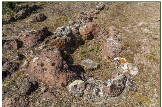
Abb. 6-7 - Räume und Feuerstellen des Heiligtums des Tophets.