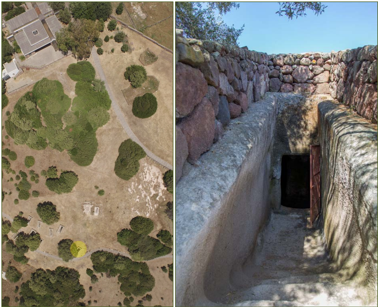
Abb. 1-2 - Bild der unterirdischen Nekropole und des Eingangskorridors zum Grab von oben;

Das Kammergrab Nr. 5 ist das bekannteste der unterirdischen Nekropole am Monte Sirai. Die Kammer, der der übliche ( dromos genannte) Korridor mit Stufen vorausgeht (Abb. 1-3), weist einen großen zentralen Pilaster mit dekor auf, eine richtige Trennwand, die die Forscher als ein Anzeichen einer späteren und fortschrittlicheren Architektur aus der Zeit zwischen dem 4. und dem 3. Jahrhundert v. Chr. interpretieren.