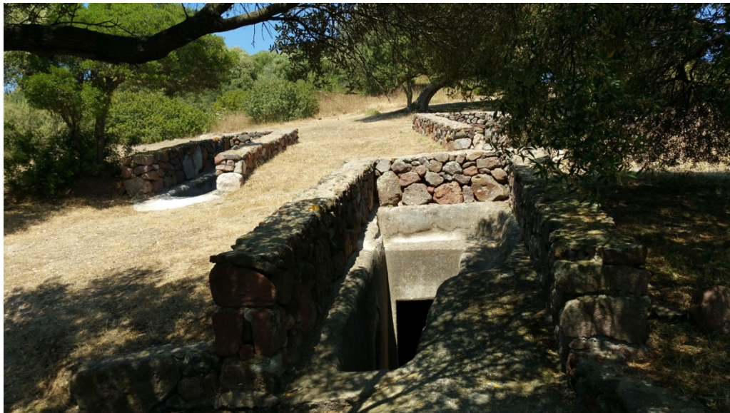
Abb. 3 - Bereich der unterirdischen Nekropole. Detail

Sie zeichnen sich durch die Verwendung von Pilastern sowie durch figurative und symbolische Dekorationen (wie Reliefmasken an den Decken oder ein auf dem Kopf stehendes Zeichen der Göttin Tanit an einem Pilaster im Grab Nr. 5 aus (Abb. 4). Bemerkenswert sind auch die Funde von in den Fels gehauenen Sarkophagen (Abb. 4) sowie Nischen mit Spuren von roter Farbe.