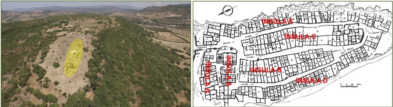
Abb. 1-2 - Monte Sirai; Planimetrie (Überarbeitung von GUIRGUIS 2013, Abb. 11)

In der dichten Bebauung der Siedlung des Monte Sirai, weist die Insula 'C' eine kompakte Erstreckung auf und endet im Südosten mit einem gebogenen Abschnitt (Abb. 1-2).