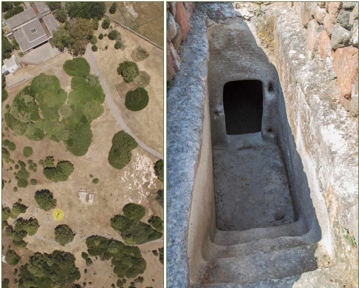
Abb. 1-2 - Bild der unterirdischen Nekropole und des Eingangskorridors zum Grab 10 von oben;

Der Eingang am Ende des üblichen Dromos mit Stufen (Abb. 1-2) öffnet sich auf einer der Langseiten, wie bei den Gräbern 2, 4 und 8 der gleichen Nekropole.