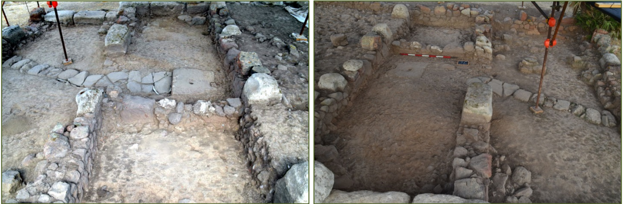
Abb. 4,5 - Das "Tuff-Haus", Ausgrabung 2015.