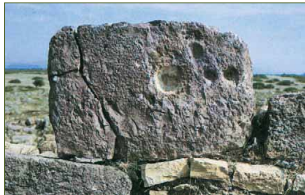
Abb. 3-4 - Der Astarte-Tempel (Überarbeitung Foto Unicity 2015) mit dem Menhir mit schalen (BARTOLONI 2004, Abb. 4).

Bei der archäologischen Analyse wurde festgestellt, dass die Menhire in der hellenistischen Zeit in den letzten Jahrzehnten des 3. Jahrhunderts v. Chr. wiederverwendet wurden. Zwischen der Anhöhe des Tophets und der unterirdischen Nekropole, im Ort sowie im Grab 207 sind Spuren einer vorausgehenden prähistorischen Phase vorhanden, die bereits in Mauerwerk und Funden der Monte-Claro-Kultur belegt sind.