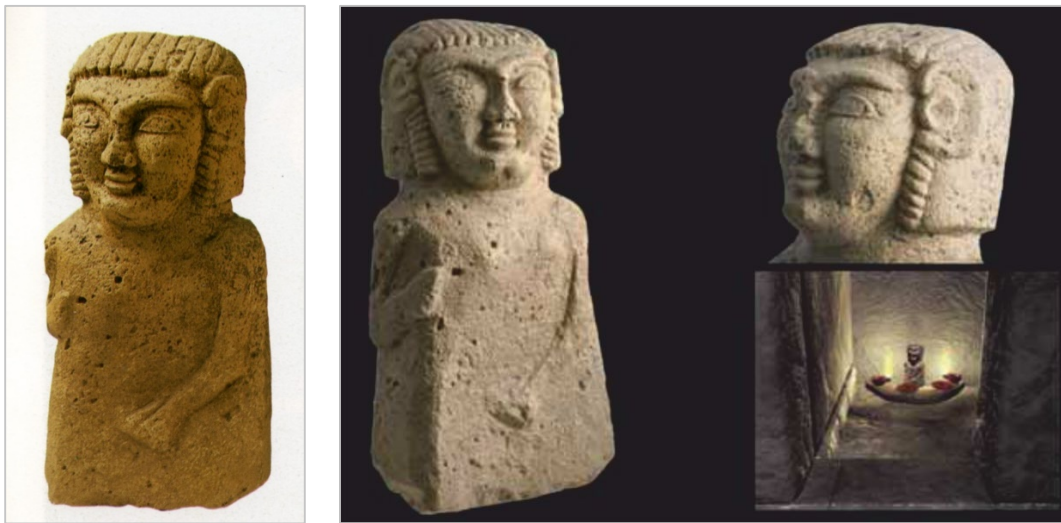
Abb. 1, 2 - Astarte-Statue vom Monte Sirai (MOSCATI 1988b, p. 286); Rekonstruktionshypothese des Saecellums mit der Astarte-Statue (GUIRGUIS 2013, Abb. 16)

Die Kultstatue, die mit der Göttin Astarte (Ashtart) in Zusammenhang steht (Abb. 1), Göttin der phönizischen Kultur der Astral Werte, verbunden mit der Sphäre der Liebe und Heilung, wurde im Jahr 1964 in einer der Zellen des gleichnamigen Tempels gefunden. Die Zelle gehört der neopunischen Phase des Tempels an (Abb. 2), das Erzeugnis stammt jedoch zumindest aus dem 7. Jahrhundert v. Chr.